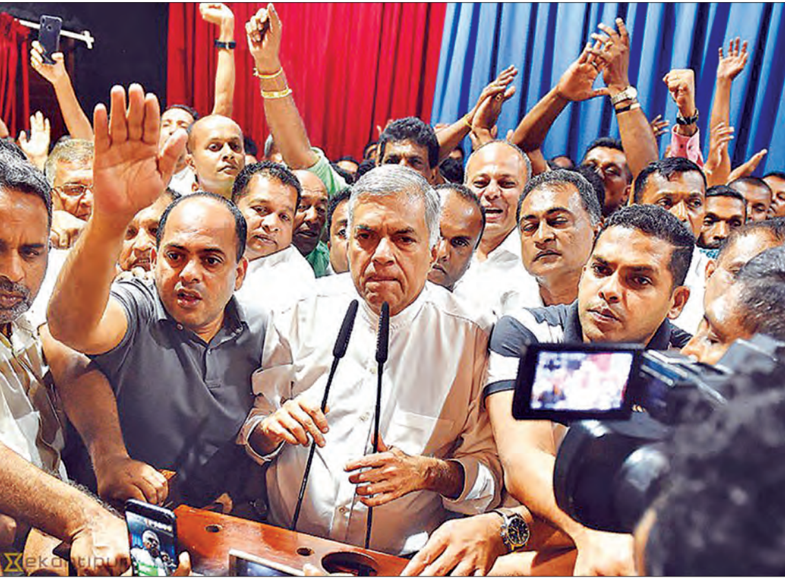
ဝန်ကြီးချုပ်ကို ဖြုတ်ချနိုင်သည့် သမ္မတ၏အာဏာကို ဖယ်ရှားပေးရေး ပြင်ဆင်ပေးရန်တောင်းဆိုနေသည့် ရန်နေးလ်ဝှစ်ခရမန်ဆင်းဂက် တွေ့ရစဉ်။

“ရန်နေးလ်ဝှစ်ခရမန်ဆင်းဂက်ဟာ ၂၀၁၅ ခုနှစ် ဩဂုတ်လမှာ ဝန်ကြီးချုပ်ရာထူးကို ပြန်လည်ရရှိခဲ့ပါတယ်။ သူဟာ ချက်ချင်း ဆိုသလို အရင်ဖြစ်ရပ်မျိုးမဖြစ်ဖို့၊ ဝန်ကြီးချုပ်ကို ဖြုတ်ချနိုင်တဲ့ နိုင်ငံအကြီးအကဲရဲ့ လုပ်ပိုင်ခွင့်အာဏာကို ဖယ်ရှားဖို့၊ ဖွဲ့စည်းပုံ အခြေခံဥပဒေကို ပြင်ဆင်ဖို့လုပ်ဆောင်ခဲ့”