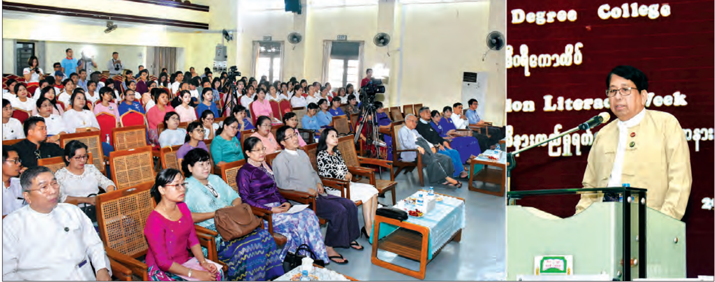
ကမ္ဘာလုံးဆိုင်ရာ မီဒီယာနှင့် သတင်းအချက်အလက် သိန်းလည်မှုရက်သတ္တပတ် အခမ်းအနားတွင် ပြည်ထောင်စုဝန်ကြီး ဒေါက်တာဖေမြင့် အမှာစကားပြောကြားစဉ်။

မိမိတို့ ပြန်ကြားရေးဝန်ကြီးဌာန၊ ပြန်ကြားရေးနှင့် ပြည်သူ့ ဆက်ဆံရေးဦးစီးဌာနအနေဖြင့် စာပေနှင့် ပတ်သက်သည့် လှုပ်ရှားမှုများ စာပေပွဲတော်များကို ကျင်းပနေပါကြောင်း၊ လာမည့် နိုဝင်ဘာ ၃၀ ရက်နှင့် ၃၁ ရက်တို့တွင် နေပြည်တော်၌ စာတတ်သူတိုင်းစာဖတ်ရေးဆိုသည့် ခေါင်းစဉ်ဖြင့် ပွဲတစ်ခု