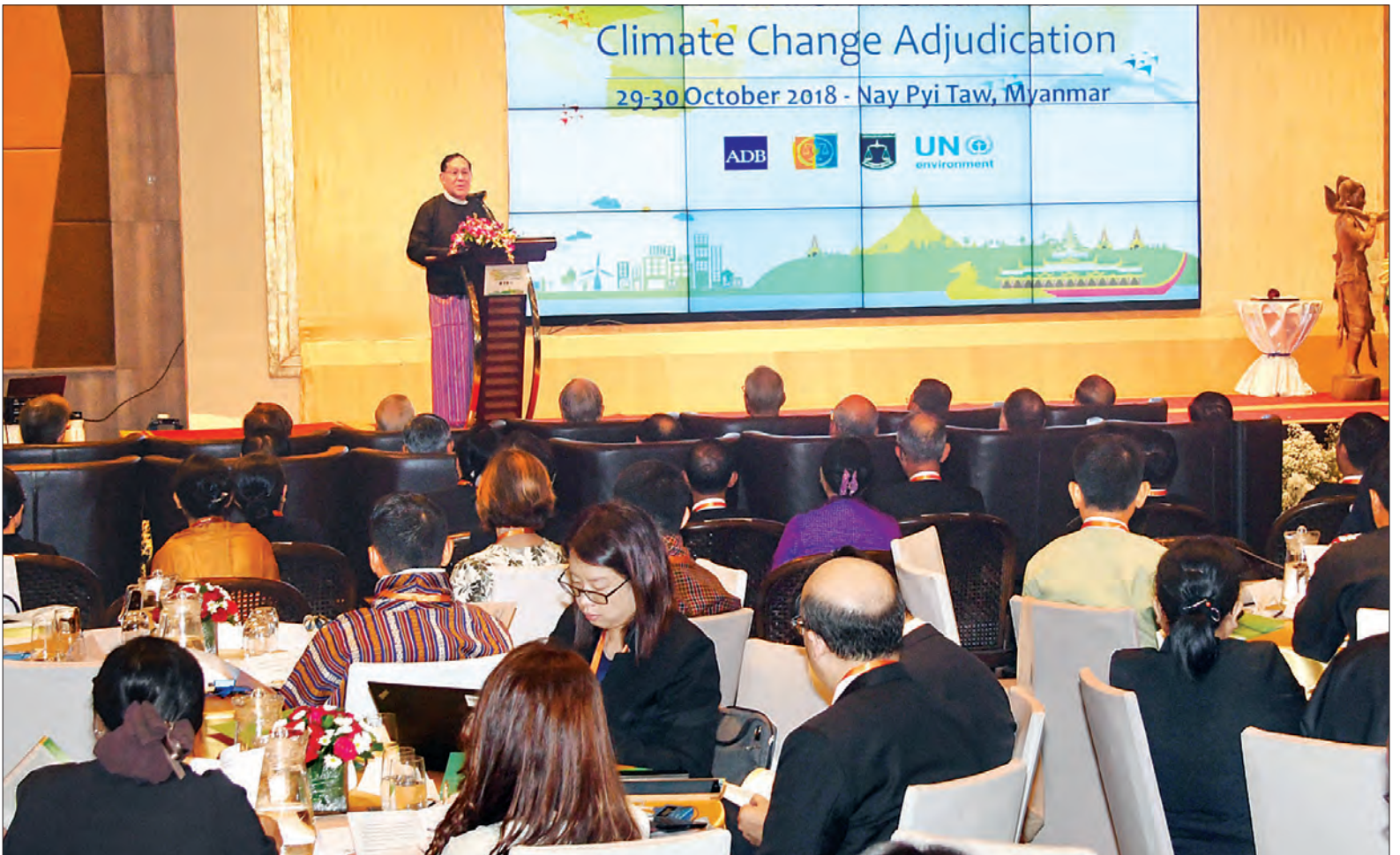
ပြည်ထောင်စုတရားသူကြီးချုပ် ဦးထွန်းထွန်းဦး ပတ်ဝန်းကျင်ထိန်းသိမ်းရေးနှင့် ရာသီဥတုပြောင်းလဲမှုအတွက် တရားရုံးစီရင်ဆုံးဖြတ်မှုဆိုင်ရာ အာရှ-ပစိဖိတ် တရားရေးညီလာခံဖွင့်ပွဲတွင် အမှာစကားပြောကြားစဉ်။

ညီလာခံကို သဘာဝပတ်ဝန်းကျင်နှင့် ရာသီဥတုပြောင်းလဲခြင်းဆိုင်ရာ အမှုများ စစ်ဆေးစီရင်မှုနှင့် စပ်လျဉ်း၍ တိုးတက် ခိုင်မာလာစေရေးအတွက် ကျင်းပခြင်းဖြစ်ပြီး အာရှနှင့် ပစိဖိတ်ဒေသတွင်းနိုင်ငံများ ပူးပေါင်း၍ ပတ်ဝန်းကျင်ထိန်းသိမ်းမှုဆိုင်ရာ တရားမျှတမှု၊ ပတ်ဝန်းကျင်ထိန်းသိမ်းရေးဆိုင်ရာ အမှုများ စစ်ဆေးစီရင်ခြင်း၊ စီရင်ထုံးများ စာမျက်နှာ ၃ ကော်လံ ၁ ❖