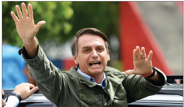
ဘရာဇီးနိုင်ငံ ရီယိုဒီဂျနေရိုးမြို့၌ ပြုလုပ်သော ဒုတိယအကျော့ မဲပေးပွဲသို့ ရောက်ရှိလာသော ဘော်ဆွန်နယ်ရှိကို တွေ့ရစဉ်။

ဘရာဇီးနိုင်ငံတွင် လက်ယာယိမ်းနိုင်ငံရေးသမားဖြစ်သူ ဂျာရီဘော်ဆွန်နယ်ရှိကို သမ္မတသစ်အဖြစ် ရွေးချယ်ခဲ့သည်။ ၎င်းသည် ပြိုင်ဘက်ဖြစ်သူ လက်ဝဲစွန်းရောက် ဖာနန်ဒိုတိုလာဒိုအိတ်ကို ၁၀ ရာခိုင်နှုန်းအသာဖြင့် တနင်္ဂနွေနေ့က ပြုလုပ်ခဲ့သော ရွေးကောက်ပွဲတွင် အနိုင်ယူခဲ့သည်။