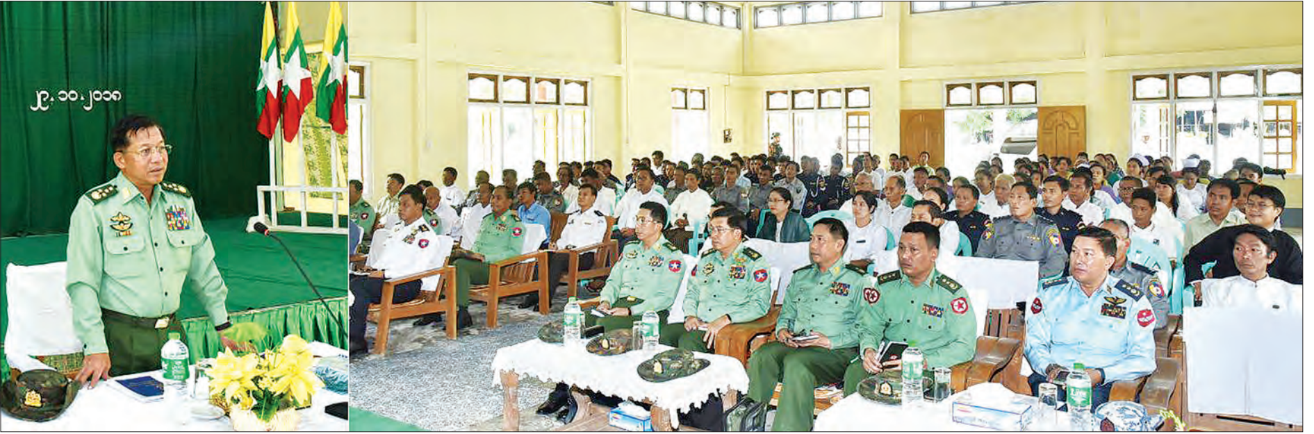
နေပြည်တော် အောက်တိုဘာ ၂၉

တပ်မတော်ကာကွယ်ရေးဦးစီးချုပ် ဗိုလ်ချုပ်မှူးကြီး မင်းအောင်လှိုင်သည် ယနေ့ နံနက်ပိုင်းတွင် ရန်ကုန်တိုင်းဒေသကြီး ကိုကိုးကျွန်းမြို့နယ်ရှိ ဌာနဆိုင်ရာဝန်ထမ်းများနှင့် ဒေသခံပြည်သူများအား ကိုကိုးကျွန်းမြို့ရှိ မြို့နယ်ခန်းမ၌ တွေ့ဆုံအမှာစကားပြောကြားသည်။