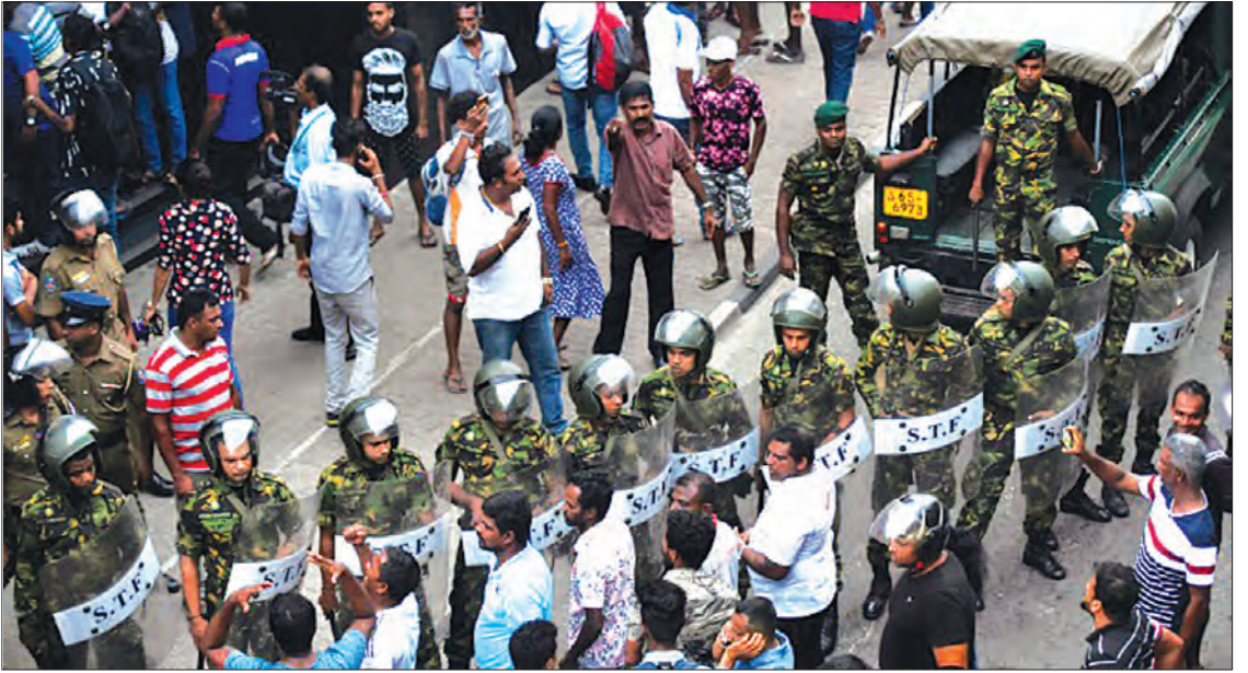
သီရိလင်္ကာတွင် လုံခြုံရေးတပ်ဖွဲ့ဝင်များနှင့် ပဋိပက္ခဖြစ်နေသော လူအုပ်ကြီးကို တွေ့ရစဉ်။