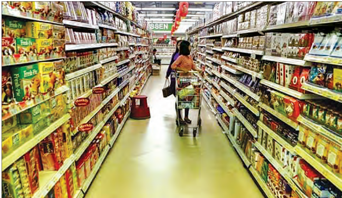
အဆိုပါထုတ်ပြန်ချက်တွင် ဦးစားပေးကုန်စည်များအဖြစ် အစားအသောက်များတွင် အချိုရည်နှင့် လှော်ဖို၊ နို့နှင့် နို့ထွက်ပစ္စည်းများ၊ အသားနှင့် အသားထွက်ပစ္စည်းများ၊ ပုစွန်ပုစွန်အမျိုးမျိုး၊ ငရုတ်ဆီနှင့် အချဉ်ရည်အမျိုးမျိုး၊ အသင့်စားမုန့်အမျိုးမျိုး၊ ဆေးလိပ်အမျိုးမျိုး၊ ယမကာအမျိုးမျိုး၊ ကလေးအာဟာရဖြည့်စွက်စာအမျိုးမျိုးနှင့် အခြားပြုပြင်ထုပ်ပိုးထားသော စားသောက်ကုန်အမျိုးမျိုး၊ ထို့အပြင် အိမ်သုံးပစ္စည်းများထဲတွင် လျှပ်စစ်နှင့် အီလက်ထရွန်နစ်ပစ္စည်းအမျိုးမျိုးတို့နှင့် ကလေးအသုံးအဆောင်

“လုပ်ငန်းရှင်တွေအနေနဲ့ သုံးစွဲဖို့အညွှန်း၊ ထားသိုသိမ်းဆည်းပုံ အညွှန်း၊ ဓာတ်မတည့်ကြောင်း ဖော်ပြချက်၊ ကြိုတင်သတင်းပေးချက်တွေနဲ့ ဘေးထွက်ဆိုးကျိုးတွေကို မြန်မာဘာသာနဲ့ ဖော်ပြရမှာ ဖြစ်ပါတယ်။ လိုက်နာမှုမရှိရင် စားသုံးသူအကာအကွယ်ပေးရေး ဥပဒေပုဒ်မ ၁၉ အရ အရေးယူသွားမှာဖြစ်ပါတယ်။ အခု အမိန့်ကြော်ငြာစာထုတ်ပြီး ခြောက်လပြည့်တာနဲ့ အရေးယူမှုတွေကို လုပ်ဆောင်တော့မှာ ဖြစ်ပါတယ်” ဟု ၎င်းက ပြောသည်။