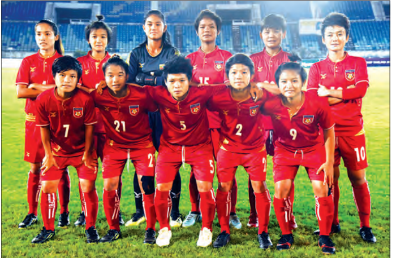
ပထမအဆင့် ခြေစစ်ပွဲ ယှဉ်ပြိုင်ကစားခဲ့သည့် မြန်မာ ယူ-၁၉ အမျိုးသမီးအသင်း။

ဒုတိယအဆင့်ခြေစစ်ပွဲကို ၂၀၁၉ ခုနှစ် ဧပြီလတွင် ကျင်းပမည်ဖြစ်ပြီး ပထမအဆင့်မှ တက်ရောက်လာသည့် ရှစ်သင်းအား လေးသင်းနှစ်အုပ်စုခွဲ၍ ကျင်းပမည် ဖြစ်သည်။ ဒုတိယအဆင့်တွင် အုပ်စုတစ်စုစီမှ ထိပ်ဆုံးနှစ်သင်းစီမှာ ခြေစစ်ပွဲအောင်မြင်မည် ဖြစ်သည်။ ပထမအဆင့် ခြေစစ်ပွဲအပြီးတွင် မြန်မာအသင်းအပါအဝင် တောင်ကိုရီးယား၊