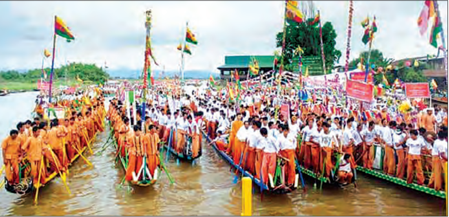
နေမျိုးသူရိန်