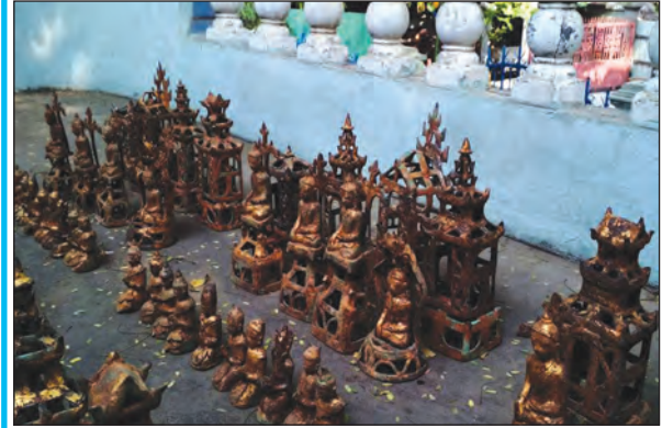
ကြေးသွန်း ပန်းတည်းပညာဖြင့် ပြုလုပ်ထားသော ဆင်းတုနှင့် ရုပ်တုများ