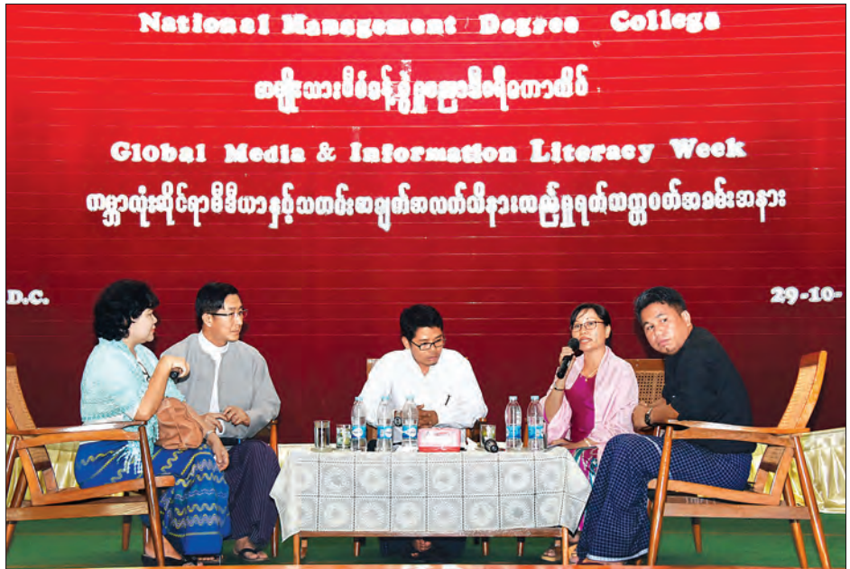
“မီဒီယာနှင့် သတင်းအချက်အလက်ဆိုင်ရာ သိန်းလည်မှုသည် လူ့အဖွဲ့အစည်းအတွက် ဘာကြောင့်အရေးကြီးပါသနည်း” ခေါင်းစဉ် ဖြင့် စကားပိုင်းဆွေးနွေးပွဲ ပြုလုပ်စဉ်။

မှတ်သားဖွယ်ရာ မိုးရေချိန်များ နေပြည်တော် အောက်တိုဘာ ၂၉ မှတ်သားဖွယ်ရာ မိုးရေချိန်များမှာ နေပြည်တော် (ဧယျာသီရိမြို့နယ်) နှင့် နေပြည်တော် (ပုဗ္ဗသီရိမြို့နယ်) တို့ တွင် ၀ ဒသမ ၇၉ လက်မစီ၊ မတူပီမြို့ တွင် ၀ ဒသမ ၆၃ လက်မ၊ ကျောက်ဖြူမြို့ တွင် ၀ ဒသမ ၅၀ လက်မ၊ အမ်းမြို့နှင့် တောင်ကုတ်မြို့တို့တွင် ၀ ဒသမ ၃၁ လက်မတို့ ဖြစ်ကြသည်။ ဘင်္ဂလားပင်လယ်အော် အခြေ အနေမှာ ကပ္ပလီပင်လယ်ပြင်တွင် တိမ်အသင့်အတင့် ဖြစ်ထွန်းနေပြီး ဘင်္ဂလားပင်လယ်အော်တွင် တိမ် အသင့်အတင့်မှ တိမ်ထူထပ်နေသည်။ မိုး/လေ