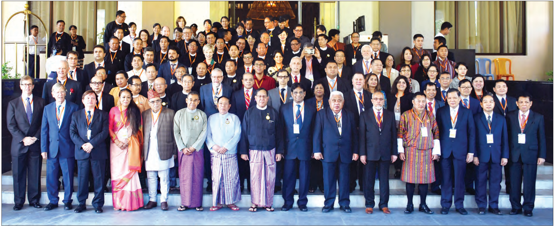
ပြည်ထောင်စုတရားသူကြီးချုပ် ဦးထွန်းထွန်းဦး ပတ်ဝန်းကျင်ထိန်းသိမ်းရေးနှင့် ရာသီဥတုပြောင်းလဲမှုအတွက် တရားရုံးစီရင်ဆုံးဖြတ်မှုဆိုင်ရာ အာရှ-ပစိဖိတ် တရားရေးညီလာခံဖွင့်ပွဲတွင် တက်ရောက်လာကြသူများနှင့်အတူ စုပေါင်းမှတ်တမ်းတင်ဓာတ်ပုံရိုက်စဉ်။

◆ ရှေ့မှ လိုက်နာမှု အားကောင်းလာစေရေး၊ ပတ်ဝန်းကျင် ထိန်းသိမ်းရေးဆိုင်ရာ အုပ်ချုပ်မှုတို့နှင့်ပတ်သက်၍ အကောင်းဆုံး ကျင့်သုံးမှုများကို တရားသူကြီးများနှင့် ဥပဒေပညာရှင်များအကြား ကျယ်ကျယ်ပြန့်ပြန့် အပြန်အလှန် ဆွေးနွေးလေ့လာနိုင်ရန် ရည်ရွယ်ကျင်းပခြင်းဖြစ်သည်။ ညီလာခံကို အောက်တိုဘာ ၂၉ ရက်