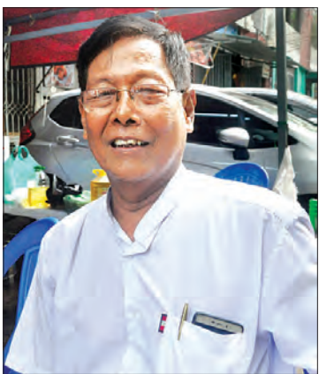
ဦးသန်းညွန့်