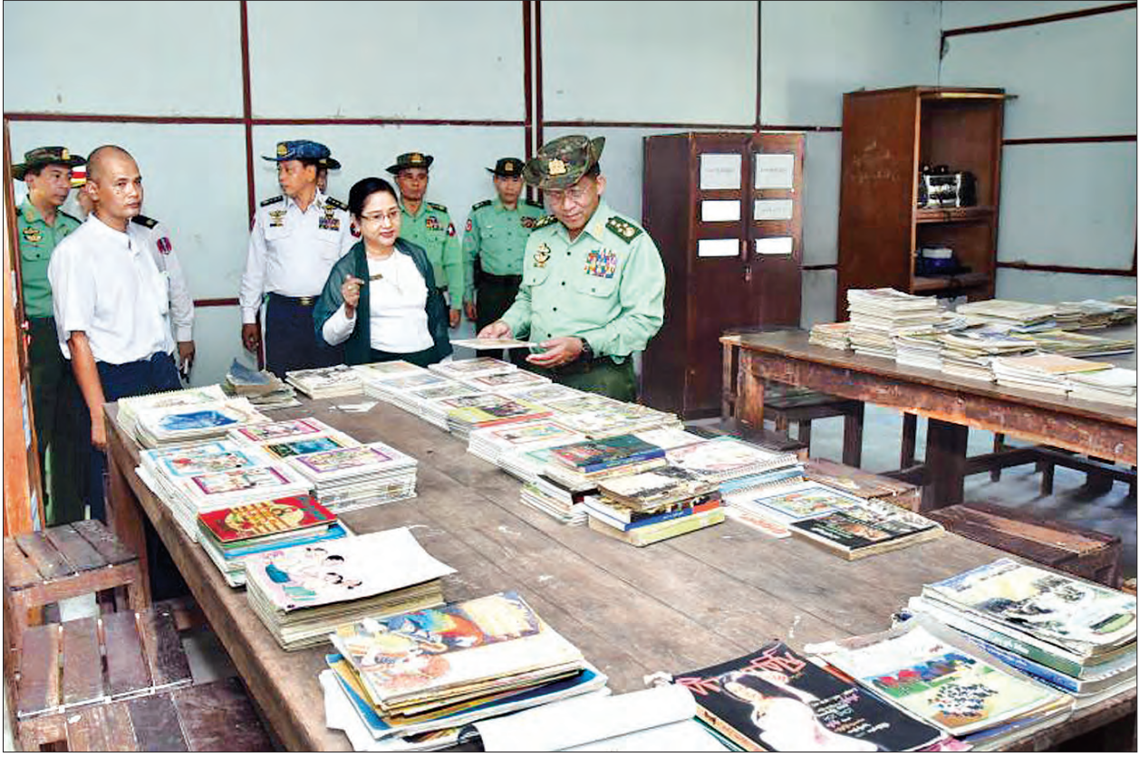
တပ်မတော်ကာကွယ်ရေးဦးစီးချုပ် ဝိုလ်ချုပ်မှူးကြီး မင်းအောင်လှိုင် ကိုကိုးကျွန်းမြို့ အခြေခံပညာအထက်တန်းကျောင်း စာကြည့်တိုက်အတွင်း လှည့်လည်ကြည့်ရှုစဉ်။

ကျောစုံမှ ယင်းနောက် နယ်မြေခံရတပ်စခန်း အစည်းအဝေးခန်းမတွင် ရေတပ်စခန်းမှူး က နယ်မြေဒေသဆိုင်ရာ အချက်အလက် များ၊ နယ်မြေဒေသလုံခြုံရေး ဆောင်ရွက် ထားရှိမှု အခြေအနေများနှင့် သဘာဝ သယံဇာတ အရင်းအမြစ်များ ထိန်းသိမ်း ဆောင်ရွက်နေမှု အခြေအနေများနှင့် ကိုကိုးကျွန်းဒေသ ဖွံ့ဖြိုးတိုးတက်ရေး အတွက် ဆောင်ရွက်နေမှု အခြေအနေ များအား ရှင်းလင်းတင်ပြသည်။ သဘာဝဘေးအန္တရာယ်က ကူညီနိုင်ရေး ရှင်းလင်း တင်ပြမှုများအပေါ် တပ်မတော် ကာကွယ်ရေးဦးစီးချုပ်က ကိုကိုးကျွန်းဒေသ ဒေသခံပြည်သူများအား တပ်မတော်လေယာဉ်၊ ရေယာဉ်များနှင့် ပို့ဆောင်ပေးရာတွင် လိုအပ်ချက်အတိုင်း ပို့ဆောင်ပေးနိုင်ရေး စီစဉ်ဆောင်ရွက် ပေးရန်နှင့် သဘာဝဘေးအန္တရာယ်များ ဖြစ်ပေါ်ပါက အမြန်ဆုံး ကူညီနိုင်ရေး ဆောင်ရွက်သွားရန်တို့ကို မှာကြားသည်။ ထို့နောက် တပ်မတော်ကာကွယ်ရေး ဦးစီးချုပ်သည် ကိုကိုးကျွန်းမြို့နယ်ရှိ ဌာန ဆိုင်ရာဝန်ထမ်းများနှင့် ဒေသခံပြည်သူ များအား မြို့နယ်ခန်းမ၌ တွေ့ဆုံအမှာ စကား ပြောကြားသည်။ မိမိဒေသဖွံ့ဖြိုးအောင် ဆောင်ရွက်လိုစိတ် ထိုသို့တွေ့ဆုံရာတွင် တပ်မတော် ကာကွယ်ရေးဦးစီးချုပ်က မိမိတို့အနေဖြင့် ၂၀၁၁ ခုနှစ်မှစတင်၍ ကိုကိုးကျွန်းဒေသ ဖွံ့ဖြိုးတိုးတက်ရေးအတွက် ဆောင်ရွက်