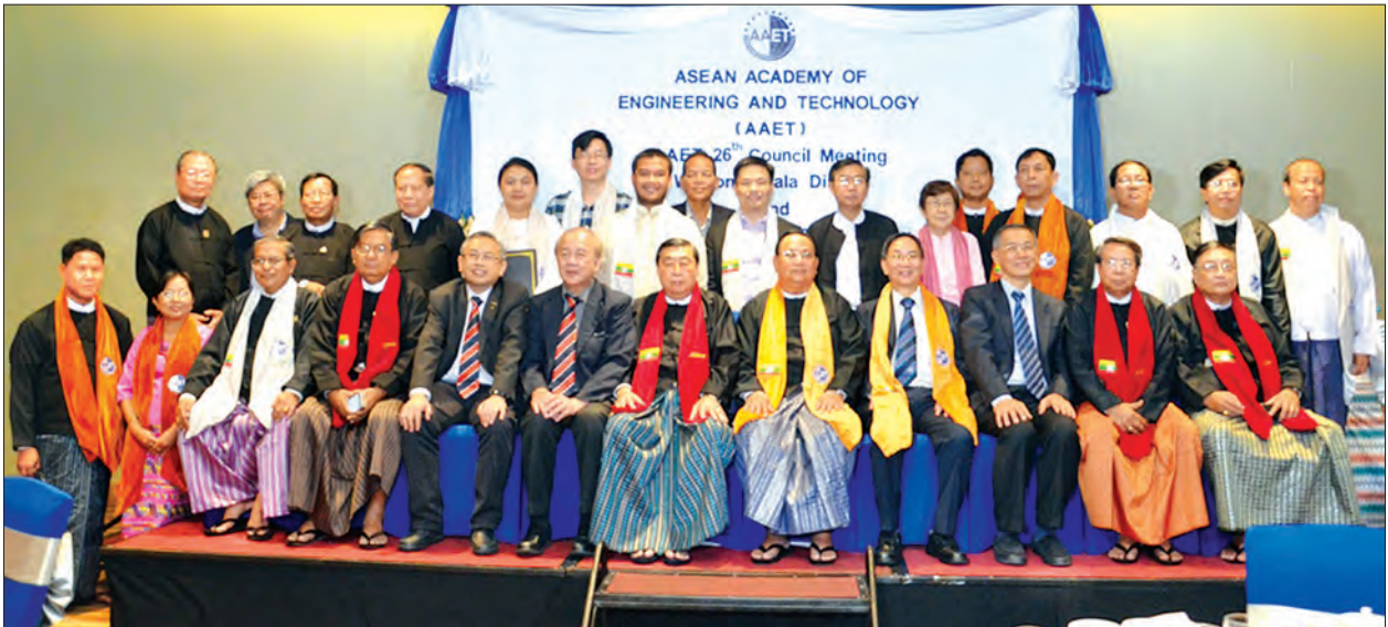
ပြည်ထောင်စုဝန်ကြီး ဦးဝင်းခိုင် အာဆီယံအင်ဂျင်နီယာနှင့် နည်းပညာအကယ်ဒမီ၏(၂၆) ကြိမ်မြောက် ကောင်စီအစည်းအဝေး ဂုဏ်ပြု ဥပဒေအခမ်းအနားတွင် တက်ရောက်လာကြသူများနှင့် စုပေါင်းမှတ်တမ်းတင်ဓာတ်ပုံရိုက်စဉ်။

ရန်ကုန် အောက်တိုဘာ ၂၉ လှုပ်စစ်နှင့် စွမ်းအင်ဝန်ကြီးဌာန ပြည်ထောင်စုဝန်ကြီး ဦးဝင်းခိုင်သည် အောက်တိုဘာ ၂၇ ရက် ညနေ ၆ နာရီတွင် ရန်ကုန်မြို့၊ နိုဝိုက်တယ်တိုက်၌ ကျင်းပသည့် အာဆီယံအင်ဂျင်နီယာနှင့် နည်းပညာအကယ်ဒမီ၏(၂၆) ကြိမ်မြောက် ကောင်စီအစည်းအဝေး ဂုဏ်ပြုဥပဒေအခမ်းအနားပွဲသို့ တက်ရောက်ခဲ့သည်။