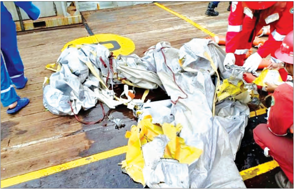
ရေအောက်မှ ဆယ်ယူရရှိသော လေယာဉ်အပျက်အစီး အပိုင်းအစများကို တွေ့ရစဉ်။