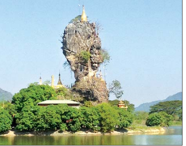
ဘားအံမြို့နယ်ရှိ ကျောက်ကလပ်

လှိုင်းဘွဲ့မြို့နယ်၌ အစိုးရအထက်တန်းကျောင်း ၁၃ ကျောင်း၊ အထက်တန်းကျောင်းခွဲ ၁၆ ကျောင်း၊ အလယ်တန်း ကျောင်း ၂၅ ကျောင်း၊ အလယ်တန်းကျောင်းခွဲ ၁၈ ကျောင်း၊ မူလတန်းလွန်နှင့် မူလတန်းကျောင်း ၂၀၅ ကျောင်း