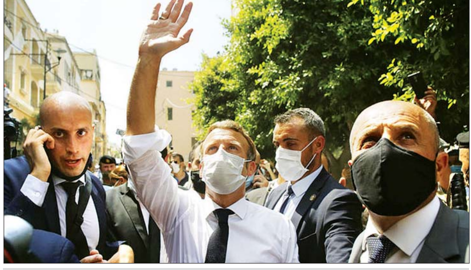
ပြင်သစ်သမ္မတ မက်ခရူန်ဩဂုတ် ၆ ရက်က လက်ဘနွန်နိုင်ငံသို့ သွားရောက်စဉ်အတွင်း ဒေသခံများကို နှုတ်ဆက်နေစဉ်။

အကျင်းများကို ဆွေးနွေးသွားရန် မျှော်လင့်ထားသည်ဟု အီရတ်အစိုးရ သတင်းအရင်းအမြစ်က အေအက်ဖ်ပီ သို့ ပြောသည်။ အီရတ်အရာရှိ နှစ်ဦးက ပြင်သစ် သမ္မတမက်ခရူန် အီရတ်နိုင်ငံသို့ လာရောက်မည့်ခရီးစဉ်ကို အတည်ပြု ခဲ့သော်လည်း သမ္မတ မက်ခရူန် ဘက်ကမူ အဆိုပါခရီးစဉ်နှင့်ပတ်သက် ပြီး အတည်ပြုခြင်း မရှိပေ။