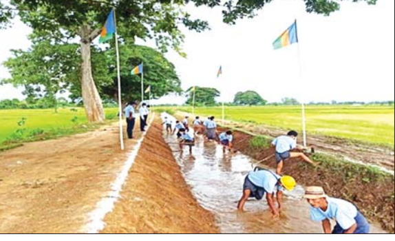
တိုင်းဒေသကြီးအတွင်းမှ ဆည်ရေပေးမြောင်းတစ်ခုကို ပြုပြင်နေစဉ်။

ကောင်းမွန်စေရေးအတွက် မြောင်းပုံစံပြုပြင်ခြင်း၊ တူးမြောင်းရေပေးအဆောက်အအုံများ ပြုပြင်ခြင်းတို့ကို ဆောင်ရွက်လျက်ရှိပြီး တိုင်းဒေသကြီးအစိုးရအဖွဲ့၏ စီမံမှုဖြင့် ကျေးလက်ဒေသ သောက်သုံးရေကန်များ တူးဖော်ခြင်း၊ စိုက်ပျိုးရေးအသုံးပြုသည့် ကျေးလက်ဆည်ကန်များ ပြုပြင်ခြင်း၊ စိုက်ပျိုးရေး စက်ရေတွင်းများ တူးဖော်ပေးခြင်း၊ မြောင်းပေါင်လမ်းများ (ကျေးရွာကုန်ထုတ်လမ်း) အဆင့်မြှင့်တင်ပြုပြင်ခြင်း၊ မြောင်းကူးတံတားများ ပြုပြင်ပေးခြင်းနှင့် ဒေသထွက်ကုန်များ လွယ်ကူစွာ သယ်ပို့နိုင်စေခြင်းတို့ဖြင့် ဒေသခံ တောင်သူများ၏ အကျိုးစီးပွားအတွက် တစ်ဖက်တစ်လမ်းမှ ကူညီဖြည့်ဆည်းပေးလျက်ရှိကြောင်း သိရ