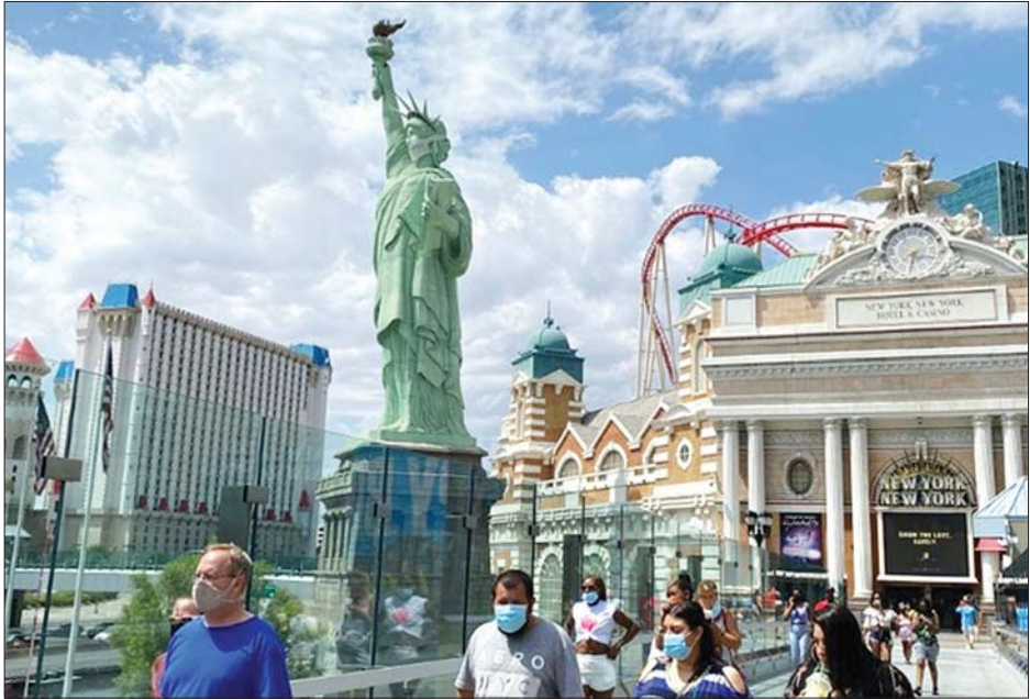
နီယူးယောက်မြို့နယ် လတ်ဗီးဂတ်စ်မြို့၌ နှာခေါင်းစည်းတပ် သွားလာနေသူများကို တွေ့ရစဉ်။

နယူးဇီလန်နဲ့ တောင်ကိုရီးယားနိုင်ငံတို့က ကူးစက်မှုကို ယခင်က ထိန်းချုပ်နိုင်ခဲ့သော်လည်း နောက်ပိုင်းမှာ အစုလိုက်အပြုံလိုက် ပြန်လည် ဖြစ်ပွားလာခဲ့တဲ့ ကိုဗစ်- ၁၉ ဟာ ဇွန်ပဲကြီးတဲ့ ရန်သူ တော်ကြီးအဖြစ် သက်သေပြခဲ့တယ်ဆိုတာ ငြင်းမရ