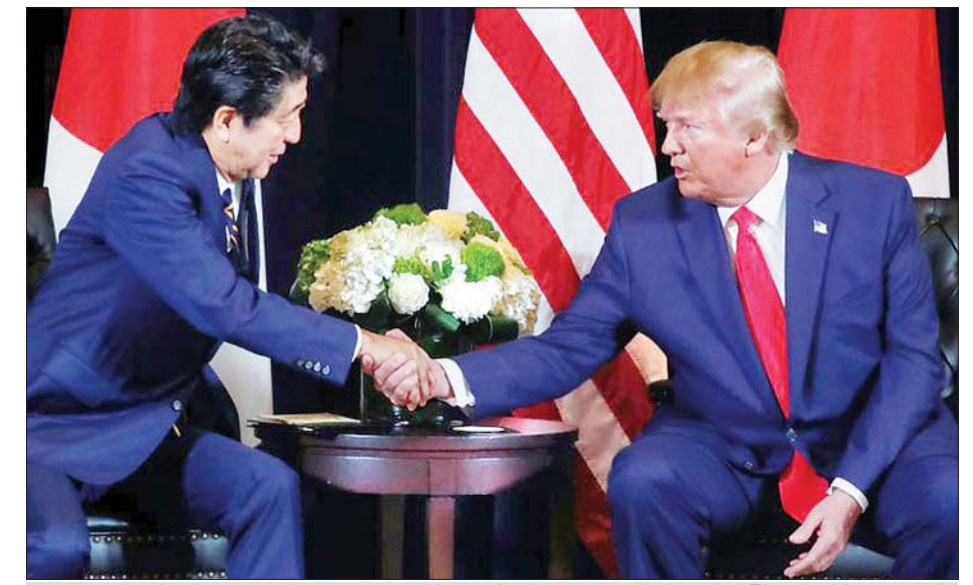
၂၀၁၉ ခုနှစ် စက်တင်ဘာ ၂၅ ရက်က နယူးယောက်၌ အမေရိကန်သမ္မတ ထရမ်နှင့် ဂျပန်ဝန်ကြီးချုပ် ရှင်ဇီအာဘေးတို့ တွေ့ဆုံကြစဉ်။

အာဘေးက မြောက်ကိုရီးယား၏ ဂျပန်နိုင်ငံသားများကို ပြန်ပေးဆွဲမှုများတွင် ဆက်လက်ကူညီဖြေရှင်းပေးရန် အမေရိကန်သမ္မတ ဒေါ်နယ်ထရမ်အား တောင်းဆိုလိုက်သည်။ ထို့အပြင် နှစ်နိုင်ငံခေါင်းဆောင်များသည် ကိုဗစ်-၁၉ တိုက်ဖျက်ရေးကာကွယ်ဆေးများထုတ်ဖော်ရာတွင် အတူတကွလုပ်ဆောင်ကြရန် သဘောတူခဲ့ကြသည်။ ထို့အပြင် အာဘေးသည် ရုရှားသမ္မတ ဗလာဒီမာပူတင်နှင့် ဖုန်းဖြင့်ဆက်လက်ဆွေးနွေးရန် စီစဉ်ထားကြောင်း ပြောသည်။