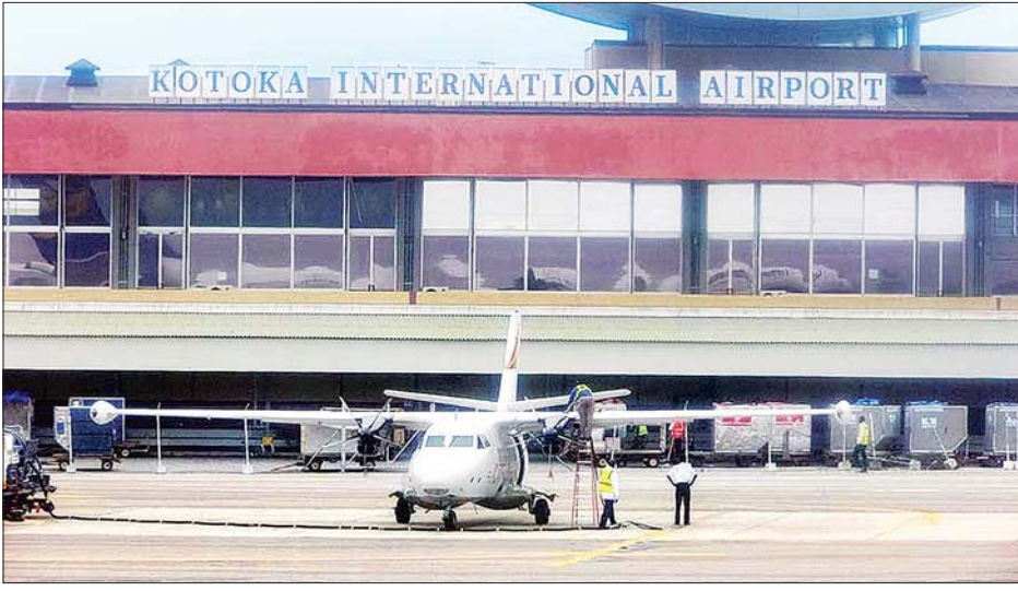
မြို့တော် အက်ခရာရှိ ကိုတိုကာလေဆိပ်ကို တွေ့ရစဉ်။

ပြောကြားသည်။ ဂါနာနိုင်ငံတွင် ကိုဗစ်-၁၉ စတင် ဖြစ်ပွားချိန်မှစတင်ကာ ယနေ့အချိန် အထိ ကူးစက်ခံရသူပေါင်း ၄၄၂၀၅ ဦး ရှိပြီး သေဆုံးသူ ၂၇၆ ဦးရှိသည်ဟု သိရသည်။ ဆင်ပွာ