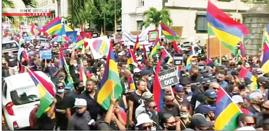
ပိုလူးဝစ်တွင် ဆန္ဒပြနေသူများအား တွေ့ရစဉ်။