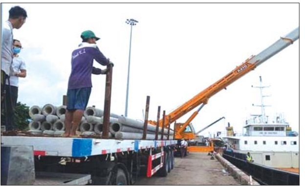
ကိုကိုးကျွန်းမြို့နယ် နေရာချခြင်းအင်အား ဆိုလာဟိုက်ဒရောလစ် ဓာတ်အားပေးစက် တည်ဆောက်မှုများကို ရန်ကုန်ဆိပ်ကမ်းမှ ပို့ဆောင် နေစဉ်။

စနစ်နဲ့ မီးလင်းနိုင်ရေးလုပ်ငန်းစီမံချက်ကို ဆောင်ရွက်ထားတာပါ။ လျှပ်စစ်ဓာတ် အားပေးစက် ၂၄ နာရီ အသုံးပြုနိုင်မှာဖြစ်တဲ့အတွက် မြို့နယ်ရဲ့ ပညာရေး၊ ကျန်းမာရေး၊ စီးပွားရေးနဲ့ လူမှုရေးကဏ္ဍ လိုအပ်ချက်များကို တစ်ဖက် တစ်လမ်းက ဖြည့်ဆည်းပေးနိုင်ပါပြီ။ ဒါကြောင့် ရန်ကုန်တိုင်းဒေသကြီး အစိုးရဘဏ်ဂျာနယ်က သန်း ၃၀၀၀ နဲ့ နေရာချခြင်းအင်အားဟိုက်ဒရောလစ် ဓာတ်အားပေးစက် တည်ဆောက်မှုကို တင်ဒါစိစစ်ပြီးတော့ ၂၀၂၀ ဒီဇင်ဘာ လကုန်အပြီး လျှပ်စစ်ဓာတ်အားပေးစက် ၂၄ နာရီအသုံးပြုနိုင်ဖို့ ခန့်မှန်းထားပါတယ်” ဟု ရန်ကုန်တိုင်းဒေသ ကြီးလွှတ်တော် ဘဏ္ဍာရေး၊ စီမံကိန်းနှင့် စီးပွားရေးကော်မတီဥက္ကဋ္ဌ ဒေါ်စန္ဒာမင်း က ပြောကြားသည်။ ရန်ကုန်တိုင်းဒေသကြီး ဖွံ့ဖြိုးတိုးတက်မှုတွင် လျှပ်စစ်ဓာတ်အား ပြည့်ဝစွာ အသုံးပြုနိုင်မှုသည် အရေးပါသည့်အပြင် ကိုကိုးကျွန်းမြို့နယ်၌ စိုက်ပျိုးရေး၊ ခရီးသွားလုပ်ငန်းနှင့် အပန်းဖြေစခန်းများ တည်ဆောက်နိုင်ရန် လျှပ်စစ်ဓာတ်အား ပြည့်ဝစွာ ရရှိအသုံးပြုနိုင်ရန်အတွက် နိုင်ငံတော် အနေဖြင့် နေရာချခြင်းအင်အား ဆိုလာဟိုက်ဒရောလစ် ဓာတ်အားပေးစက်