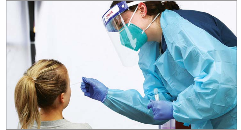
ဩစတြေးလျနိုင်ငံ ဆစ်ဒနီတွင် ကျန်းမာရေးဝန်ထမ်းတစ်ဦးက ကိုဗစ်-၁၉ စစ်ဆေးမှု ဆောင်ရွက်နေစဉ်။

များလာသောကြောင့် ဝန်ကြီးချုပ် ဒန်နီရယ်အန်ဒရူးက လာမည့် တနင်္ဂနွေနေ့တွင် ဖြေလျှော့ပေးမည့် လမ်းညွှန်ချက်များ ထုတ်ပြန်ပေးမည် ဖြစ်သော်လည်း တချို့ကို မပြောင်းလဲဘဲ နှုတ်အတိုင်းထားမည် ဖြစ်ကြောင်း ပြောကြားလိုက်သည်။ ယခုတစ်ခါကိုဗစ်-၁၉ ကူးစက်ခံရပါက ထိန်းချုပ်၍ ရနိုင်တော့မည် မဟုတ်ကြောင်း ၎င်းက ဆက်လက် ပြောကြားလိုက်သည်။ ဩစတြေးလျတွင် ကိုဗစ်-၁၉ ကူးစက်ခံရသူပေါင်း ၂၆၀၀၀ ရှိလာပြီး သေဆုံးသူပေါင်း ၆၅၂ ဦး ရှိလာခဲ့သည်။