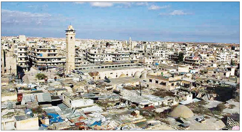
တိုက်ပွဲများကြောင့် ဆီးရီးယားနိုင်ငံအတွင်း ပျက်စီးနေမှုများကို တွေ့ရစဉ်။

ကျဆင်းခြင်းများနှင့် ကြုံတွေ့နေရသည်။ ဆီးရီးယားနိုင်ငံ ၏ စီးပွားရေးတွင် ရုန်းကန်ခြင်းမှာ အနောက်နိုင်ငံများ၏ ပိတ်ဆို့မှုပြစ်ဒဏ်များကြောင့်ဖြစ်သည်ဟု ဆီးရီးယားအစိုးရ က ပြောသည်။ သို့သော်လည်း ဆီးရီးယားနိုင်ငံ စီးပွားရေးအကျပ် ရိုက်ရခြင်းမှာ အိမ်နီးချင်းလက်ဘနွန်နိုင်ငံ၏ ဘဏ္ဍာရေး အကျပ်အတည်းနှင့်လည်း သက်ဆိုင်မှုရှိသည်ဟု သုတေသီ များက ထောက်ပြကြသည်။ ၂၀၁၁ ခုနှစ်က စတင်ခဲ့သည့် ဆီးရီးယားပဋိပက္ခအတွင်း လူပေါင်း ၃၈၀၀၀ ကျော် သေဆုံးခဲ့ပြီး လူပေါင်းသန်းနှင့်ချီ၍ နေရပ်စွန့်ခွာမှုများ ဖြစ်ပေါ်ခဲ့ရသည်။ အေအက်ဖ်ပီ