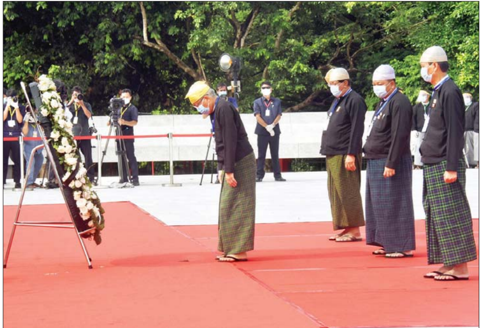
(၇၃) နှစ်မြောက် အာဇာနည်နေ့အခမ်းအနားတွင် ရန်ကုန်တိုင်းဒေသကြီး လွှတ်တော်ဥက္ကဋ္ဌနှင့် လွှတ်တော်ကိုယ်စား လှယ်များ အာဇာနည်ခေါင်းဆောင်ကြီးများ၏ ဂူဗိမာန်၌ လွမ်းသူ့ပန်းခွေချ အလေးပြုစဉ်။ သတင်းစဉ်