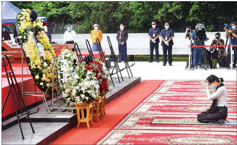
နိုင်ငံတော်သမ္မတ ဦးဝင်းမြင့်၊ ဒုတိယသမ္မတ ဦးမြင့်ဆွေ၊ ပြည်သူ့လွှတ်တော်ဥက္ကဋ္ဌ ဦးတိစ္ဆာန်မြတ်၊ အမျိုးသားလွှတ်တော် ဥက္ကဋ္ဌ မန်းဝင်းခိုင်သန်း၊ ပြည်ထောင်စုတရားသူကြီးချုပ် ဦးထွန်းထွန်းဦး၊ တပ်မတော်ကာကွယ်ရေးဦးစီးချုပ် ဗိုလ်ချုပ်မှူးကြီး မင်းအောင်လှိုင်တို့ ဗိုလ်ချုပ်အောင်ဆန်းနှင့်တကွ အာဇာနည်ခေါင်းဆောင်ကြီးများ၏ ဂူမိမိနှင့် ပြည်ထောင်စုသမ္မတမြန်မာနိုင်ငံတော်၏ လွှမ်းသူးပန်းခွေချ၍ အလေးပြုကြစဉ်။ သတင်းစဉ်