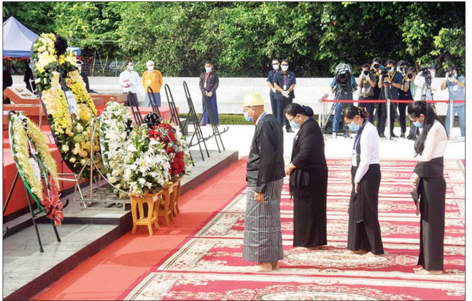
သခင်မြ ဂူဗိမာန်၌ သခင်မြ၏ မိသားစုများ လွမ်းသူ့ပန်းခွေချ အလေးပြုစဉ်။ (သတင်း - ရှေ့ဖုံး) သတင်းစဉ်