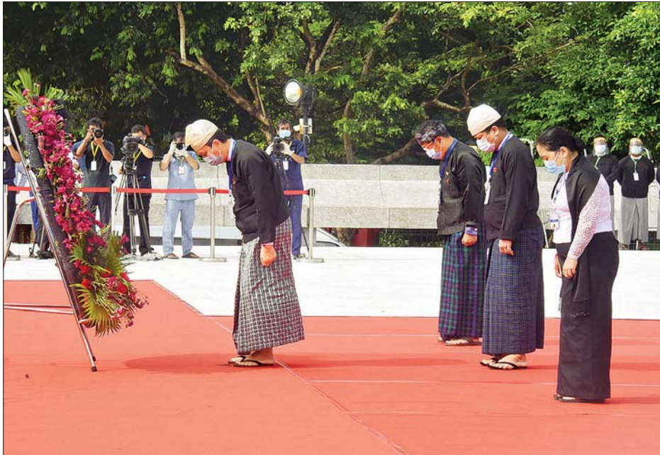
(၇၃)နှစ်မြောက် အာဇာနည်နေ့အခမ်းအနားတွင် ရန်ကုန်တိုင်းဒေသကြီးအစိုးရအဖွဲ့ အာဇာနည်ခေါင်းဆောင်ကြီးများ၏ ဂူဗိမာန်၌ လွမ်းသူ့ပန်းခွေချ အလေးပြုစဉ်။ သတင်းစဉ်

များ၊ ညွှန်ကြားချက်များနှင့်အညီ ဆောင်ရွက်ကြခြင်း ဖြစ်သည်။ အသိပေးကြေညာပေး အာဇာနည်ဗိမာန်သို့ လာရောက် ဂါရဝပြုကြသူများကို ကျန်းမာရေး နှင့်ပတ်သက်၍ လိုက်နာရမည့်အချက် များအား ပိုစတာများ၊ လက်ကမ်း စာစောင်များ၊ Hand Speaker များနှင့် သက်ဆိုင်ရာ တာဝန်ရှိသူများက အသိပေးကြေညာပေးလျက်ရှိသည်။ သတင်းစဉ်