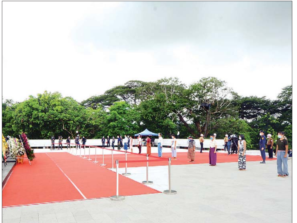
(၇၃) နှစ်မြောက် အာဇာနည်နေ့အခမ်းအနားတွင် ပြည်သူများ ရန်ကုန်မြို့ ဗဟန်းမြို့နယ်ရှိ အာဇာနည်ခေါင်းဆောင်ကြီးများ၏ ဂူဗိမာန်၌ လွမ်းသူ့ပန်းခွေချ အလေးပြုစဉ်။ (သတင်း - ရှေ့ဖုံး) သတင်းစဉ်