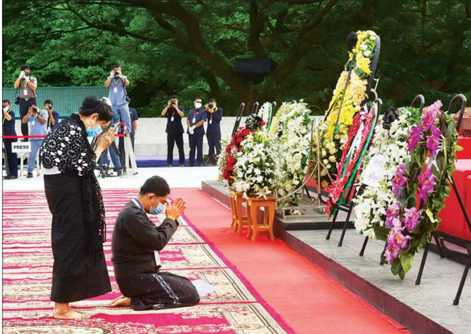
မန်းဘခိုင် ဂုဏ်မာန်၌ မန်းဘခိုင်၏ မိသားစုများ လွမ်းသောပန်းခွေချပြီး ကန်တော့စဉ်။ သတင်းစဉ်