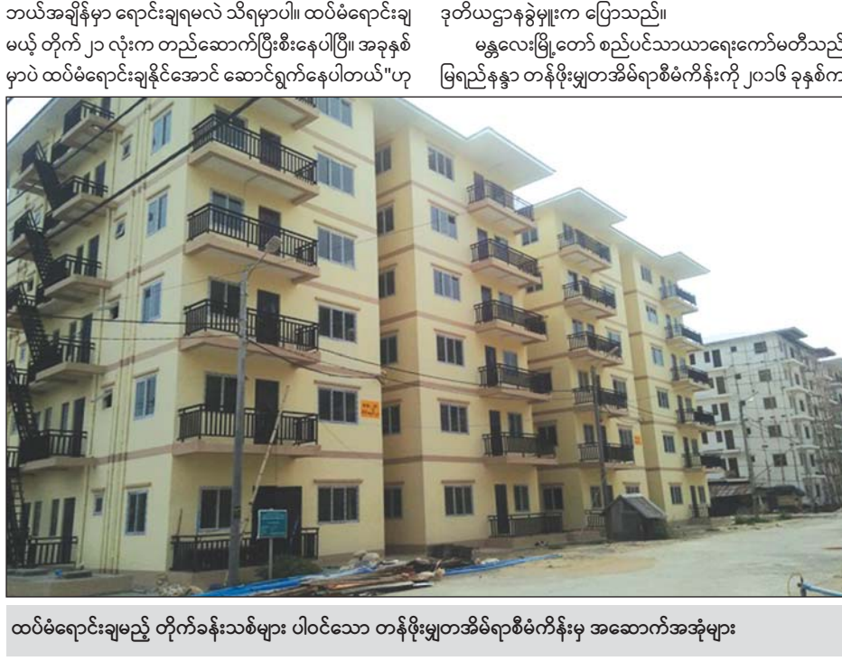
ထပ်မံရောင်းချမည့် တိုက်ခန်းသစ်များ ပါဝင်သော တန်ဖိုးမျှတအိမ်ရာစီမံကိန်းမှ အဆောက်အအုံများ

မန္တလေး ဇူလိုင် ၁၉ မန္တလေးမြို့တော် စည်ပင်သာယာရေး ကော်မတီက အကောင်အထည် ဖော်ဆောင်ရွက်ထားသော မြရည်နန္ဒာ တန်ဖိုးမျှတအိမ်ရာစီမံကိန်းမှ စတုတ္ထအကြိမ်အဖြစ် တိုက် ၂၁ လုံးမှ တိုက်ခန်းပေါင်း ၅၀၀ ကျော်ကို မဲစနစ်ဖြင့် ယခု နှစ်အတွင်း ထပ်မံရောင်းချပေးနိုင်ရန် စီစဉ်ဆောင်ရွက် လျက်ရှိကြောင်း မန္တလေးမြို့တော် စည်ပင်သာယာရေး ကော်မတီ အဆောက်အအုံနှင့် ကုန်ရုံဌာန ဒုတိယဌာနခွဲမှူး ဒေါ်မျိုးအိအိစိုးထံမှ သိရသည်။ မန္တလေးမြို့တော် စည်ပင်သာယာရေးကော်မတီအနေ ဖြင့် မြရည်နန္ဒာ တန်ဖိုးမျှတအိမ်ရာစီမံကိန်းမှ တိုက်ခန်း များကို နိုင်ငံတော်ဝန်ထမ်းများ၊ အငြိမ်းစားဝန်ထမ်းများ၊ ကုမ္ပဏီ ဝန်ထမ်းများနှင့် ပြည်သူများအား နေထိုင်ရေး အဆင်ပြေ စေရန် လက်ငင်းငွေချေစနစ် သို့မဟုတ် အရစ်ကျစနစ်ဖြင့် ရောင်းချပေးလျက်ရှိရာ ယခင်က သုံးကြိမ် ရောင်းချထားပြီး ဖြစ်သည်။ "တတိယအကြိမ်မှာ တိုက် ၂၁ လုံးမှ တိုက်ခန်းပေါင်း ၅၀၀ ကျော်ကို ပြီးခဲ့တဲ့ ဇွန်လက ရောင်းချပေးပြီးပါပြီ။ ဒီနှစ်ထဲမှာပဲ စတုတ္ထအကြိမ်မြောက်အဖြစ် တိုက် ၂၁ လုံးမှ တိုက်ခန်းများ ထပ်မံရောင်းချဖို့ ရှိပါသေးတယ်။ တိုင်း ဒေသကြီး အစိုးရအဖွဲ့ကို တင်ပြပြီး ခွင့်ပြုမိန့်ကျလျှင်