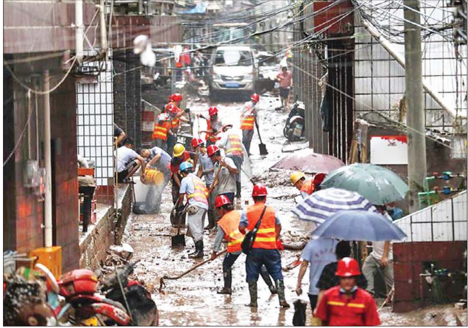
ချုံကင်းရှိ ရေနစ်မြုပ်ခဲ့သည့် နေရာတစ်ခုတွင် ဒေသခံများနှင့် စည်ပင်ဝန်ထမ်းများ ရှင်းလင်းရေးဆောင်ရွက်နေစဉ်။