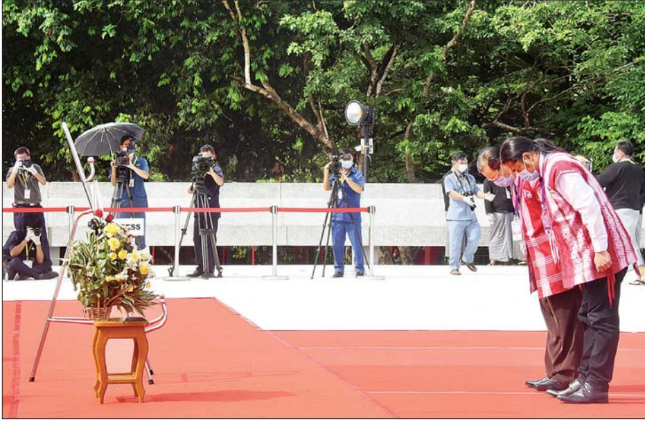
(၇၃)နှစ်မြောက် အာဇာနည်နေ့အခမ်းအနားတွင် နိုင်ငံရေးပါတီများမှ ကိုယ်စားလှယ်များ အာဇာနည်ခေါင်းဆောင်ကြီး များ၏ ဂူဗိမာန်၌ လွမ်းသူ့ပန်းခွေချ အလေးပြုစဉ်။ သတင်းစဉ်