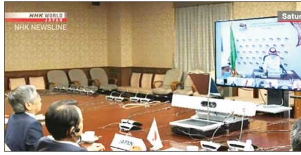
ဂျီ-၂၀ အစည်းအဝေးကျင်းပနေသည်ကို တွေ့ရစဉ်။