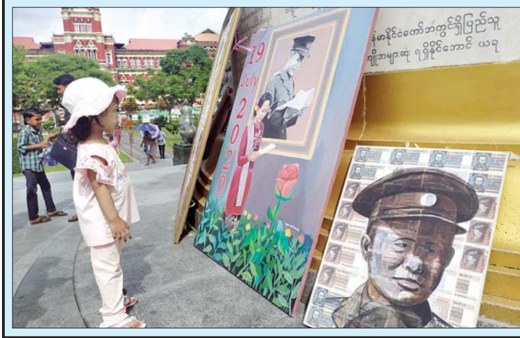
(၇၃) နှစ်မြောက် အာဇာနည်နေ့အထိမ်းအမှတ်အဖြစ် ပန်းချီဆရာတစ်ဦး ရေးဆွဲထားသည့် ဗိုလ်ချုပ် အောင်ဆန်းပုံဖြင့် ထုတ်ဝေခဲ့သော ၃၅ ကျပ်တန်၊ ၂၅ ကျပ်တန်၊ ၁၅ ကျပ်တန်၊ ၁၀ ကျပ်တန်၊ ၅ ကျပ်တန်၊ ၁ ကျပ်တန်နှင့် ငွေအကြွေစေ့ဖြစ်သည့် ပြား ၅၀၊ ၂၅ ပြား၊ ၁၀ ပြား၊ ၅ ပြားစေ့ စသည့် ပန်းချီကားများ အပြင် နိုင်ငံတော်၏အတိုင်ပင်ခံပုဂ္ဂိုလ် ဒေါ်အောင်ဆန်း စုကြည်ပုံကို ငွေစက္ကူများ နောက်ခံထား၍ ပန်းချီကား များကို ဇူလိုင် ၁၉ ရက်က ရန်ကုန်မြို့ မဟာဗန္ဓုလ ပန်းခြံ၌ ပြသထားရာ လာရောက်ကြည့်ရှုသူများကို တွေ့ရစဉ်။ အာကာစိုး

ဆက်လက်၍ အာဇာနည်ခေါင်းဆောင်ကြီးများအား ဂုဏ်ပြုသောအားဖြင့် “အလေးပြုပါသည်” သီချင်းနှင့် ဗိုလ်ချုပ်အောင်ဆန်း၏ မိန့်ခွန်းစီဒီယိုမှတ်တမ်းအားပြသပြီး အာဇာနည်နေ့အထိမ်းအမှတ် ပြိုင်ပွဲများတွင် ဆုရရှိကြ သော ကျောင်းသား ကျောင်းသူများကို ပြည်နယ် ဝန်ကြီးချုပ်နှင့် တာဝန်ရှိသူများက ဆုများ ပေးအပ်ချီးမြှင့် ကြသည်။ (ဝဲပုံ) အလားတူ ပြန်ကြားရေးနှင့်ပြည်သူ့ဆက်ဆံရေးဦးစီး ဌာန စစ်တွေခရိုင်ရုံးမှ ဝန်ထမ်းများက ပြန်ကြားရေး ဝန်ကြီးဌာနမှ ထုတ်ဝေသော အာဇာနည်နေ့အထိမ်းအမှတ် အမှတ်တရ စာအုပ်များကို အခမ်းအနားသို့တက်ရောက် လာကြသူများအား ဖြန့်ဝေပေးခဲ့ကြသည်။ အဆိုပါအခမ်းအနားသို့ ပြည်နယ်ဝန်ကြီးချုပ် ဦးညီပု နှင့် ဇနီး၊ ပြည်နယ်တရားလွှတ်တော် တရားသူကြီးချုပ်၊ ပြည်နယ်လွှတ်တော်ဒုတိယဥက္ကဋ္ဌ အနောက်ပိုင်းတိုင်း စစ်ဌာနချုပ်တိုင်းမှူး၊ ပြည်နယ်ဝန်ကြီးများနှင့် ဇနီးများ၊ ပြည်နယ်ဥပဒေချုပ်၊ ပြည်နယ်စာရင်းစစ်ချုပ်၊ နိုင်ငံရေးပါတီ များမှ ကိုယ်စားလှယ်များ၊ မြို့မိမြို့ဖများ၊ ပြည်နယ်၊ ခရိုင်၊ မြို့နယ်အဆင့်ဌာနဆိုင်ရာများ၊ လူမှုရေးအဖွဲ့အစည်းများမှ ကိုယ်စားလှယ်များ၊ ဆရာ ဆရာမများနှင့် ကျောင်းသား ကျောင်းသူများ တက်ရောက်ကြကြောင်း သိရသည်။ တင်ထွန်း(ပြန်/ဆက်)