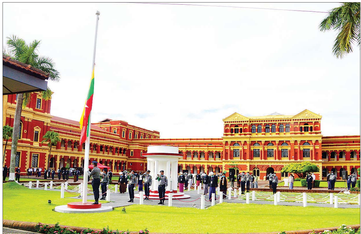
ဗိုလ်ချုပ်အောင်ဆန်းနှင့် အာဇာနည်ခေါင်းဆောင်ကြီးများ ကျဆုံးခဲ့သည့် အတွင်းဝန်ရုံးတွင် (၇၃)နှစ်မြောက် အာဇာနည်နေ့ အလံတင်အခမ်းအနား ကျင်းပစဉ်။

(၇၃) နှစ်မြောက်အာဇာနည်နေ့ ဝမ်းနည်းခြင်းအထိမ်းအမှတ်အနေဖြင့်