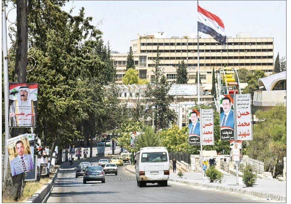
ဆီးရီးယားပြည်သူများ မဲပေးရန် မဲရုံများဆီသို့ ကားများဖြင့် သွားနေကြစဉ်။

လူပေါင်း ၃၈၀၀၀၀ သေဆုံးခဲ့သော စစ်ပွဲကြောင့် နိုင်ငံမှ ထွက်ပြေးသွားပြီးနောက် နိုင်ငံခြားတွင် နေထိုင် လျက်ရှိသော ဆီးရီးယားပြည်သူများအနေဖြင့် မဲပေးခွင့် ရမည် မဟုတ်ကြောင်း သိရသည်။ အေအက်ဖ်ပီ