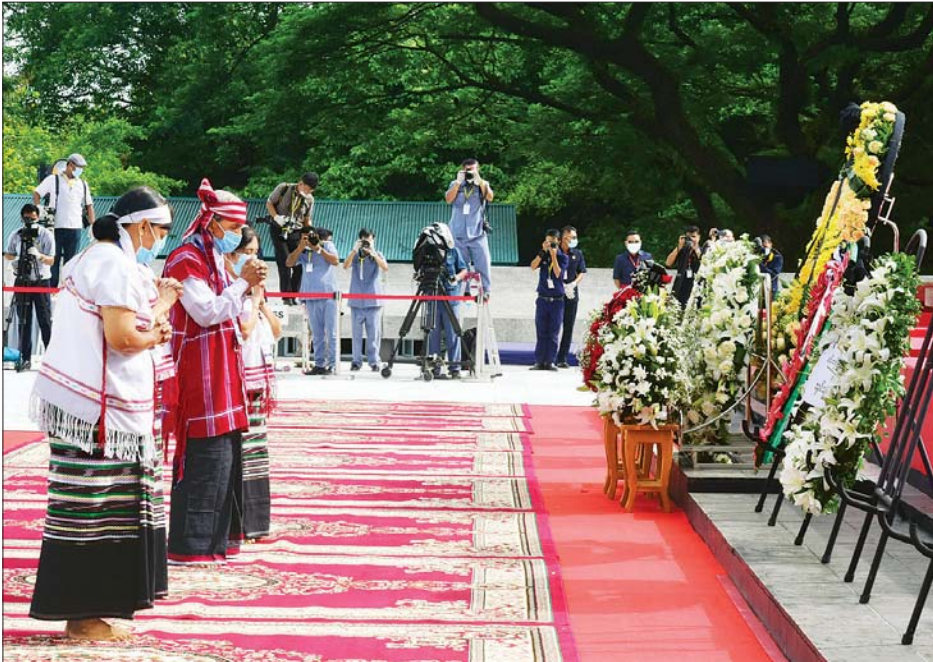
မန်းဘခိုင် ဂုဏ်မာန်၌ မန်းဘခိုင်၏ မိသားစုများ လွမ်းသောပန်းခွေချပြီး ဂါရဝပြုစဉ်။ သတင်းစဉ်

ရေး လုပ်ငန်းကော်မတီဥက္ကဋ္ဌ ရန်ကုန် တိုင်းဒေသကြီး ဝန်ကြီးချုပ်နှင့် တိုင်း ဒေသကြီး ဝန်ကြီးများ၊ တိုင်းဒေသကြီး လွှတ်တော်ဥက္ကဋ္ဌနှင့် လွှတ်တော် ကိုယ်စားလှယ်များ၊ နိုင်ငံရေးပါတီများ မှ ကိုယ်စားလှယ်များက ဗိုလ်ချုပ် အောင်ဆန်းနှင့်တကွ အာဇာနည် ခေါင်းဆောင်ကြီးများ၏ အထိမ်း အမှတ်ဂုဏ်မာန်၌ လွမ်းသောပန်းခွေချ အလေးပြုကြသည်။ ဆက်လက်၍ မြန်မာနိုင်ငံ စစ်မှုထမ်းဟောင်းအဖွဲ့၊ မြန်မာနိုင်ငံ စာမျက်နှာ ၄ သို့