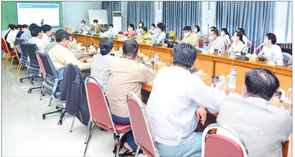
ရန်၊ လူ့စွမ်းအား အရင်းအမြစ် ဖွံ့ဖြိုးမှု အစီအစဉ်များဖြင့် ပုဂ္ဂလိကကဏ္ဍနှင့် ဆိုင်ရာ စွမ်းဆောင်ရည် မြှင့်တင်ရေး အစိုးရကဏ္ဍ ပူးပေါင်းမှု အားကောင်းစေရန်တို့ကို ရည်ရွယ် ဆောင်ရွက်ခြင်းဖြစ်ကြောင်း သိရသည်။ မေမိုးသိ

သီးနှံအမယ်စုံ တိုးချဲ့ စိုက်ပျိုးလာနိုင်စေရန်နှင့် ရွေးချယ်ထားသော တန်းဖိုးမြှင့် စိုက်ပျိုးထုတ်လုပ်မှု ကွင်းဆက်တစ်လျှောက် အရည်အသွေး ပိုမိုကောင်းမွန်မှုနှင့် ဈေးကွက်ယှဉ်ပြိုင်မှုများ တိုးမြှင့်လာနိုင်စေရန်၊ လတ်တလော ဖြစ်ပေါ်နေသည့် ကိုဗစ်-၁၉ ကပ်ရောဂါကြောင့် စိုက်ပျိုးထုတ်လုပ်မှုအား ထိခိုက်လာမှုအပေါ် ထိရောက်စွာ အမြန်ပြန်လည်ကုစားနိုင်မည့် အစီအစဉ်အတွက် လုပ်ကွက်ငယ်တောင်သူများအား ကူညီပံ့ပိုးပေး