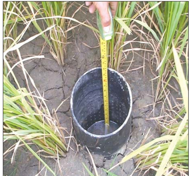
လယ်မြေတစ်ကွက်အတွင်း ရေတိုင်းကိရိယာ တပ်ဆင်ထားစဉ်

ဤနည်းစနစ်သည် စပါးစိုက်ခင်း၌ ရေပေးသွင်းရာတွင် စိုက်ခင်းရေလျော့နည်းတိုင်း ရေပေးသွင်းရမည့်အစား ရေတိုင်းကိရိယာ(Field Water Tube)ကိုသွင်း၍ မြေမျက်နှာပြင်အောက် ခြောက်လက်မအနက်တွင် ရေမရှိမှ ရေကို တစ်ဖန်ပြန်လည်သွင်းပေးခြင်း ဖြစ်သောကြောင့် အလိုအပ်ဆုံးအချိန် ရောက်မှသာ ရေပေးသွင်းသည့် စနစ်ဖြစ်သည်။