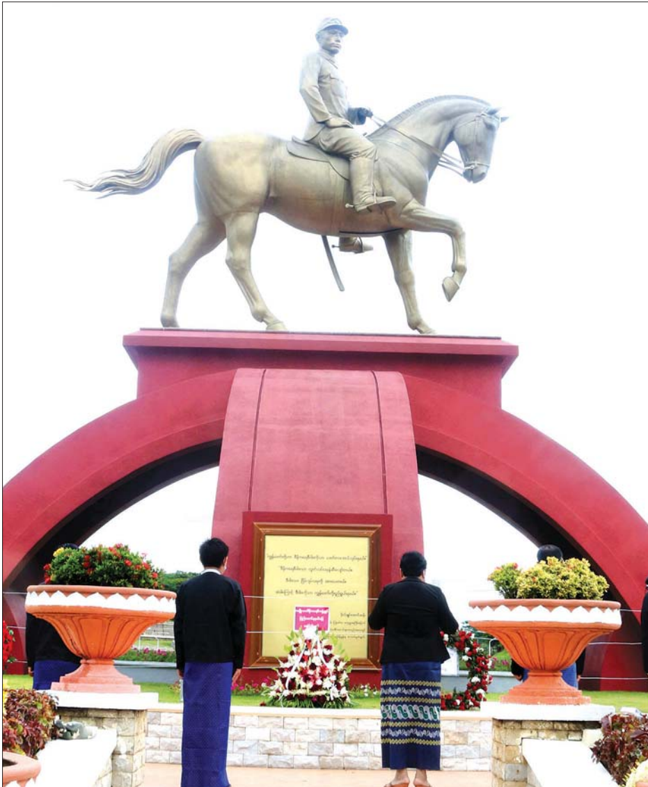
နေပြည်တော် ဇူလိုင် ၁၉

၂၀၂၀ ပြည့်နှစ် (၇၃)နှစ်မြောက် အာဇာနည်နေ့ အထိမ်းအမှတ်အခမ်းအနားများကို တစ်နိုင်လုံးအတိုင်းအတာဖြင့် ကိုဗစ်-၁၉ ရောဂါ ကာကွယ်ထိန်းချုပ်ရေး စည်းမျဉ်းစည်းကမ်း၊ သတ်မှတ်ချက်များနှင့်အညီ ကျင်းပလျက်ရှိရာ နေပြည်တော် ဧည့်သည်တော်များနှင့်အညီ ဖွဲ့စည်းပေးပြီး ဗိုလ်ချုပ်မြင်းစီးကြေးရုပ် အပေါ်၌ ယနေ့နံနက်ပိုင်းက တာဝန်ရှိသူများနှင့် ပြည်သူများလာရောက်၍ လွမ်းသူ့ပန်းခွေချ ဂါရဝပြုကြသည်။