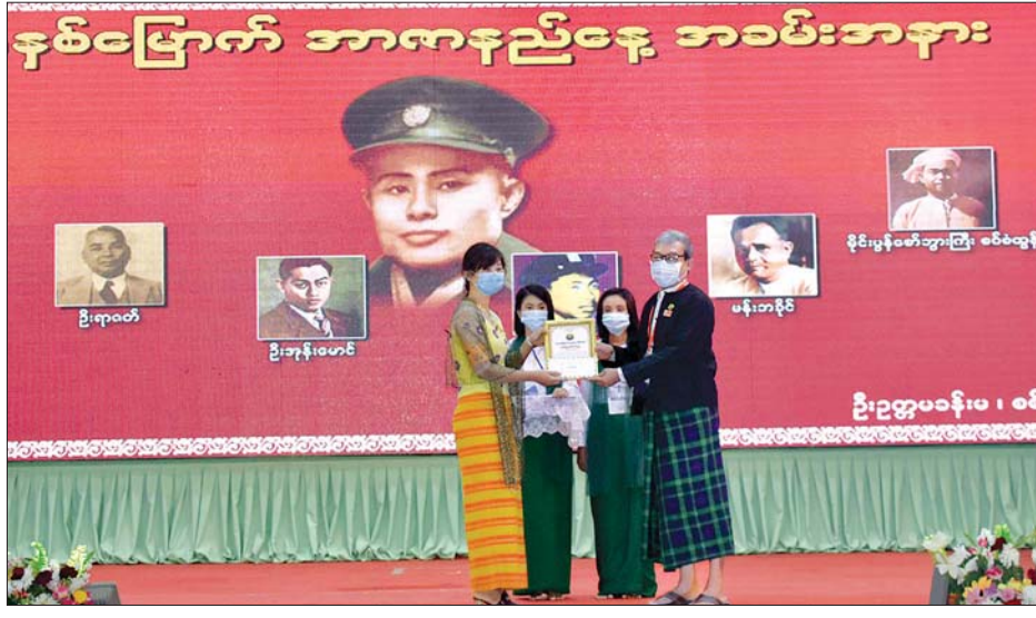
ဦးညီပုက အမှာစကားပြောကြားပြီး စစ်တွေ တက္ကသိုလ် မြန်မာစာဌာနမှ ပါမောက္ခဌာနမှူး ဒေါက်တာ မင်းမော်သန်းက အာဇာနည်နေ့ ဖြစ်ပေါ်လာပုံနှင့် အာဇာနည်ခေါင်းဆောင်ကြီးများ၏ ကိုယ်ရေးအတ္ထုပ္ပတ္တိ အား ဂုဏ်ပြုဟောပြောသည်။ ယင်းနောက် ပြည်နယ်ဝန်ကြီး ချုပ်၊ ပြည်နယ်တရားလွှတ်တော် တရားသူကြီးချုပ်၊

စစ်တွေ ဇူလိုင် ၁၉ ရခိုင်ပြည်နယ်အစိုးရအဖွဲ့က ကြီးမှူး၍ (၇၃) နှစ်မြောက် အာဇာနည်နေ့အထိမ်းအမှတ် အရုဏ်ဆွမ်း ဆက်ကပ် လှူဒါန်းခြင်း၊ အာဇာနည်နေ့အခမ်းအနားနှင့် အာဇာနည်နေ့ အထိမ်းအမှတ် စာစီစာကုံး၊ ပန်းချီ၊ ကဗျာရွတ်ဆိုပြိုင်ပွဲ များတွင် ဆုရရှိသူများအား ဆုချီးမြှင့်ခြင်း အခမ်းအနားများ ကို ယနေ့နံနက်ပိုင်းတွင် ရခိုင်ပြည်နယ်အစိုးရအဖွဲ့ရုံးနှင့် ဦးဥက္ကဋ္ဌမခန်းမတို့၌ ကျင်းပသည်။ ရှေးဦးစွာ နံနက် ၅ နာရီခွဲတွင် ရခိုင်ပြည်နယ်အစိုးရ အဖွဲ့ရုံးအစည်းအဝေးခန်းမ၌ အာဇာနည်ခေါင်းဆောင်ကြီး များအား ရည်စူးလျက် စစ်တွေမြို့ပေါ်မှ သံဃာတော် အရှင်သုမြတ် ကိုးပါးတို့အား ပြည်နယ်ဝန်ကြီးချုပ် ဦးညီပု နှင့် ဇနီး၊ ပြည်နယ်တရားသူကြီးချုပ် ပြည်နယ်ဝန်ကြီးများနှင့် ဌာနဆိုင်ရာများက အရုဏ်ဆွမ်း ဆက်ကပ်လှူဒါန်းခြင်း၊ မေတ္တာသတ်ပရိတ်တရားတော်များ နာယူခြင်း၊ လှူဖွယ် ဝတ္ထုများ ဆက်ကပ်လှူဒါန်းခြင်းနှင့် မေတ္တာပို့အမျှဝေခြင်း တို့ ပြုလုပ်ကြသည်။ ထို့နောက် နံနက် ၁၀ နာရီတွင် အာဇာနည်နေ့ အခမ်းအနားနှင့် အာဇာနည်နေ့အထိမ်းအမှတ် စာစီစာကုံး၊ ပန်းချီ၊ ကဗျာရွတ်ဆိုပြိုင်ပွဲများတွင် ဆုရရှိသူများအား ဆုချီးမြှင့်ခြင်းအခမ်းအနားကို စစ်တွေမြို့ ဦးဥက္ကဋ္ဌမခန်းမ၌ ကျင်းပသည်။ အခမ်းအနားတွင် ပြည်နယ်ဝန်ကြီးချုပ်