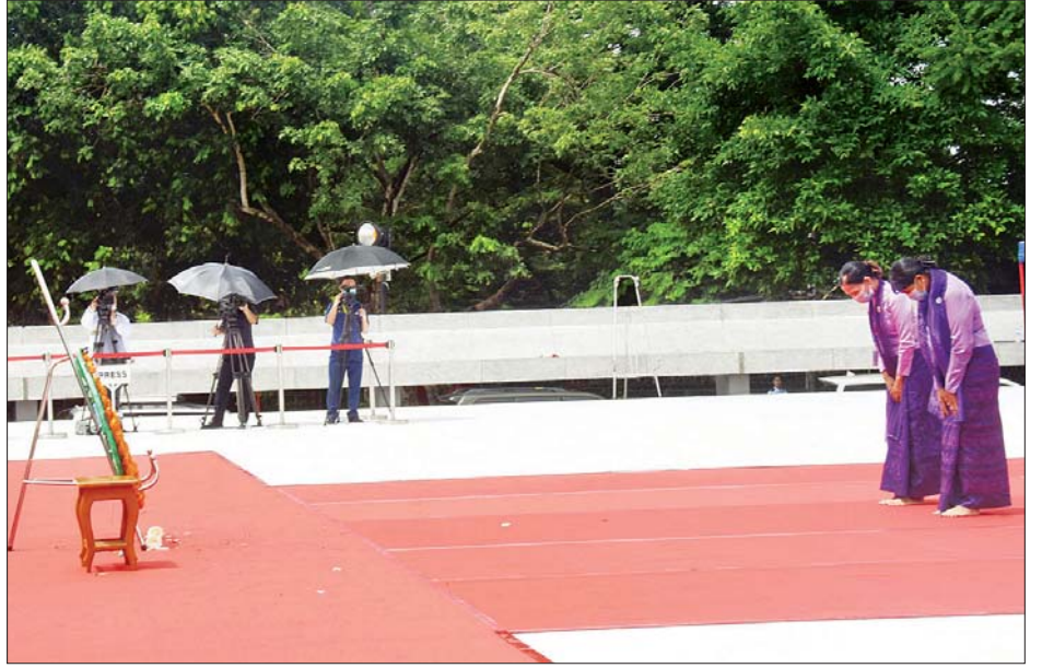
(၇၃) နှစ်မြောက် အာဇာနည်နေ့အခမ်းအနားတွင် လူမှုရေးအသင်းအဖွဲ့များ အာဇာနည်ခေါင်းဆောင်ကြီးများ၏ ဂူဗိမာန်၌ လွမ်းသူ့ပန်းခွေချ အလေးပြုစဉ်။ သတင်းစဉ်