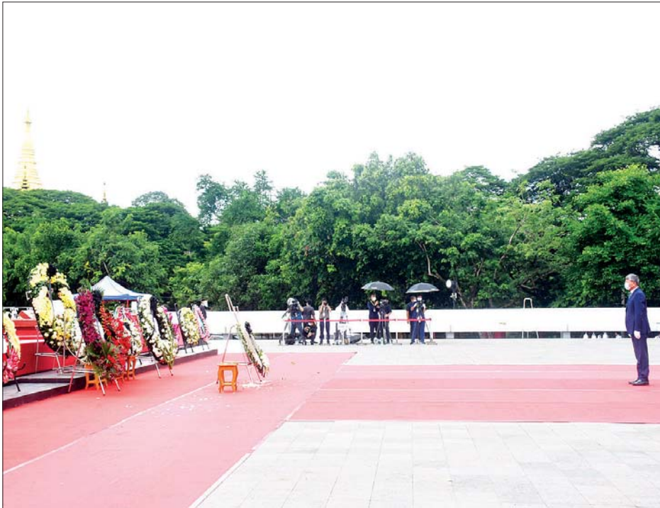
(၇၃) နှစ်မြောက် အာဇာနည်နေ့အခမ်းအနားတွင် မြန်မာနိုင်ငံဆိုင်ရာ နိုင်ငံခြားသံရုံးများ၊ ဥရောပသမဂ္ဂနှင့် ကုလသမဂ္ဂလက်အောက်ခံ အဖွဲ့အစည်းများမှ သံအမတ်ကြီးများ၊ သံရုံးယာယီတာဝန်ခံများနှင့် ကိုယ်စားလှယ်များက အာဇာနည်ခေါင်းဆောင်ကြီးများ၏ ဂူဗိမာန်၌ လွမ်းသူ့ပန်းခွေချ အလေးပြုစဉ်။ (သတင်း - ရှေ့ဖုံး) သတင်းစဉ်