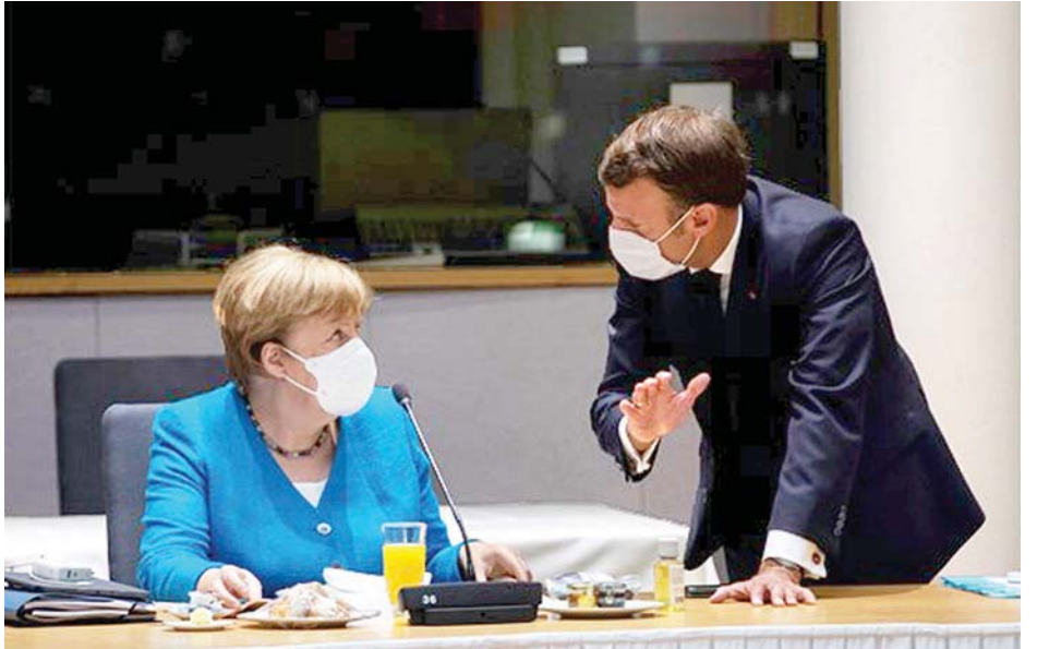
ဂျာမနီဝန်ကြီးချုပ် အန်ဂျလာမာကယ်နှင့် ပြင်သစ်သမ္မတ မက်ခရန်တို့ ဆွေးနွေးနေစဉ်။