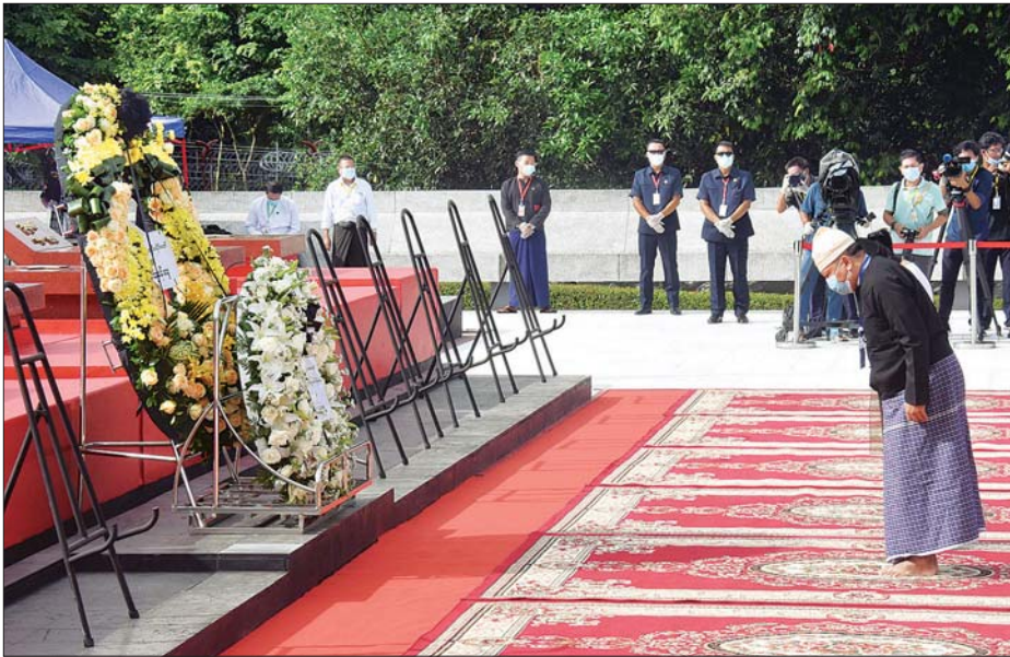
ဗိုလ်ချုပ်အောင်ဆန်း၏ သားဖြစ်သူ ဦးအောင်ဆန်းဦး ကိုယ်စား တူတော်စပ်သူ ဦးရဲအောင်သန်း လွမ်းသူ့ပန်းခွေချ အလေးပြုစဉ်။ (သတင်း - ရှေ့ဖုံး) သတင်းစဉ်