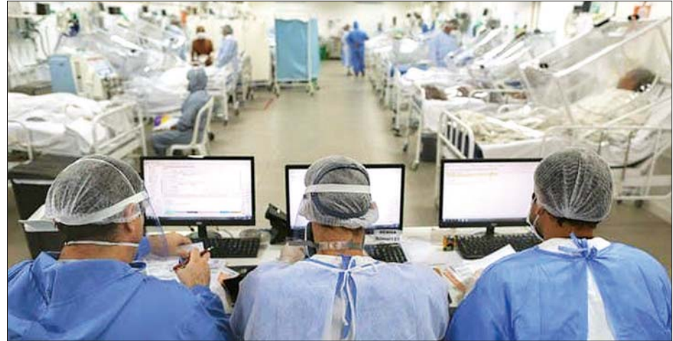
ဘရာဇီးနိုင်ငံရှိ ဂီဘာတိုနိုဗေစ်ဆေးရုံ၏ အထူးကြပ်မတ်ကုသဆောင်တစ်ခုတွင် ကိုရိုနာဗိုင်းရပ်စ်ရောဂါသည်များကို စောင့်ကြည့်ကုသမှုများ လုပ်ဆောင်နေစဉ်။