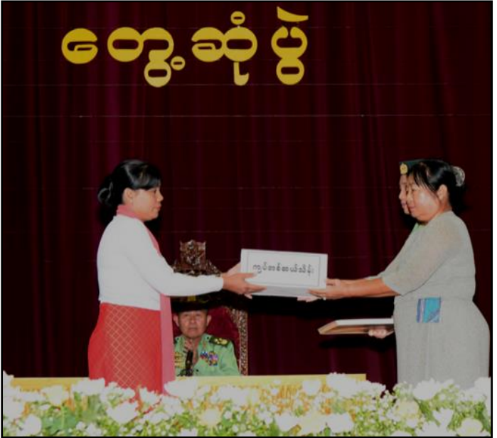
နိုင်ငံတော်စီမံအုပ်ချုပ်ရေးကောင်စီဒုတိယဥက္ကဋ္ဌ ဒုတိယတပ်မတော်ကာကွယ်ရေးဦးစီးချုပ်နှင့် ဇနီးတို့က ပြင်ဦးလွင်တပ်နယ်ရှိ အရာရှိ၊ စစ်သည်၊ မိသားစုများအတွက် ထောက်ပံ့ငွေများနှင့် စားသောက်ဖွယ်ရာများ ပေးအပ်နေမှု

နိုင်ငံတော်စီမံအုပ်ချုပ်ရေးကောင်စီဒုတိယဥက္ကဋ္ဌ ဒုတိယတပ်မတော်ကာကွယ်ရေးဦးစီးချုပ် ကာကွယ်ရေးဦးစီးချုပ်(ကြည်း)ဒုတိယဗိုလ်ချုပ်မှူးကြီးစိုးဝင်း စစ်တက္ကသိုလ်ရှိနည်းပြအရာရှိများ၊ နည်းပြဆရာ၊ ဆရာမများနှင့် သင်တန်းသားဗိုလ်လောင်းများအား တွေ့ဆုံအမှာစကားပြောကြား