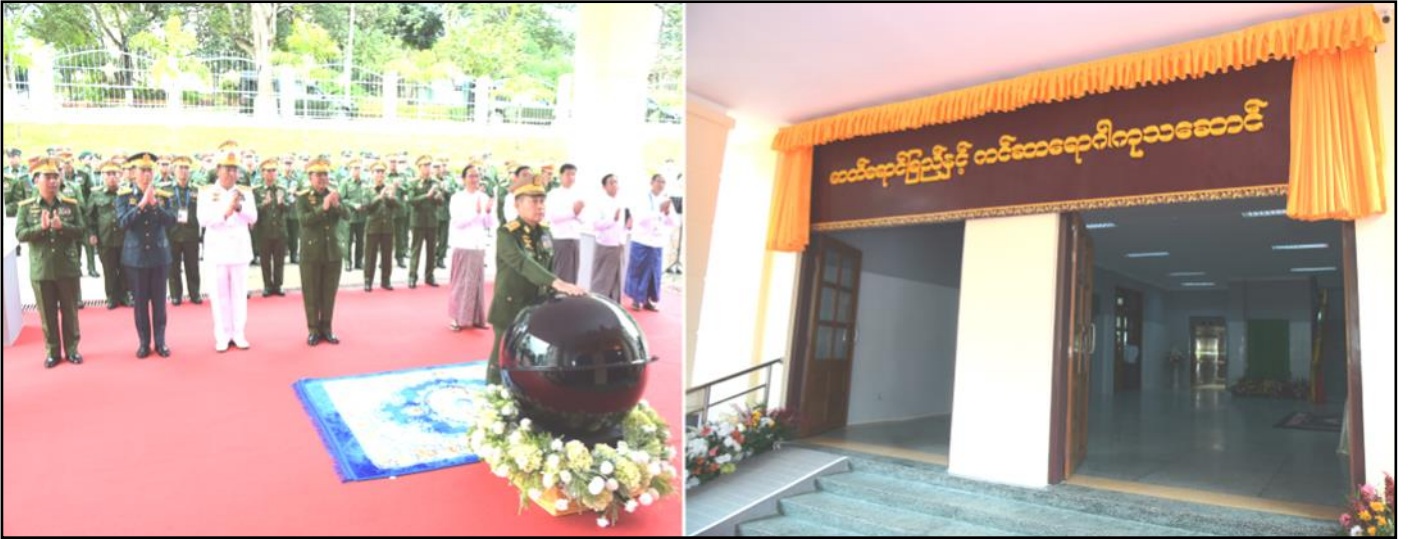
နိုင်ငံတော်စီမံအုပ်ချုပ်ရေးကောင်စီဒုတိယဥက္ကဋ္ဌ ဒုတိယတပ်မတော်ကာကွယ်ရေးဦးစီးချုပ် ဓာတ်ရောင်ခြည်နှင့် ကင်ဆာရောဂါကုသဆောင် ဆိုင်းဘုတ်အား စက်ခလုတ်နှိပ်ဖွင့်လှစ်ပေးနေမှု

တော်ဆေးရုံ(ခုတင်-၇၀၀)၊ နှစ်(၁၀၀)ပြည့် အထိမ်းအမှတ်နှင့် အကြိမ်(၃၀)မြောက် မြန်မာ့တပ်မတော်ဆေးပညာရပ်ဆိုင်ရာ နှီးနှောဖလှယ်ပွဲအထိမ်းအမှတ် ဂုဏ်ပြုအမှာစကားပြောကြား ရာတွင်-