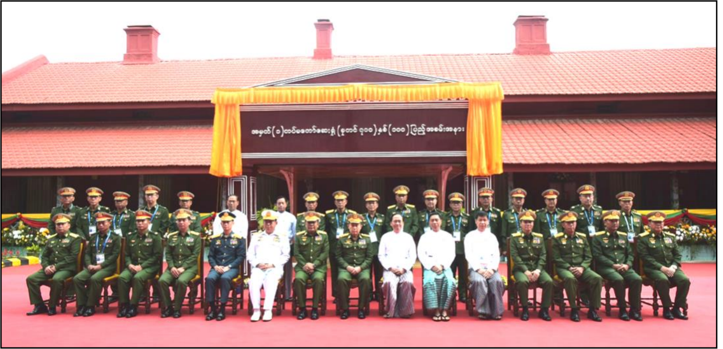
နိုင်ငံတော်စီမံအုပ်ချုပ်ရေးကောင်စီဒုတိယဥက္ကဋ္ဌ ဒုတိယတပ်မတော်ကာကွယ်ရေးဦးစီးချုပ် အခမ်းအနားတက်ရောက်လာကြသူများနှင့် အတူ စုပေါင်းမှတ်တမ်းတင်ဓာတ်ပုံရိုက်ကူးနေမှု

ကို မှန်ပြောင်းဖြင့်ခွဲစိတ်ကုသနိုင်သောဆေးရုံ ၅ ရုံရှိပြီး ဖြစ်ကြောင်း။