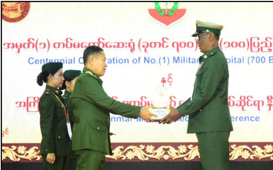
နိုင်ငံတော်စီမံအုပ်ချုပ်ရေးကောင်စီဒုတိယဥက္ကဋ္ဌ ဒုတိယတပ်မတော်ကာကွယ်ရေးဦးစီးချုပ် နှစ်(၁၀၀)ပြည့်အထိမ်းအမှတ် ဆုရရှိသည့် အရာရှိတစ်ဦးအား ဂုဏ်ပြုဆုပေးအပ်ချီးမြှင့်နေမှု