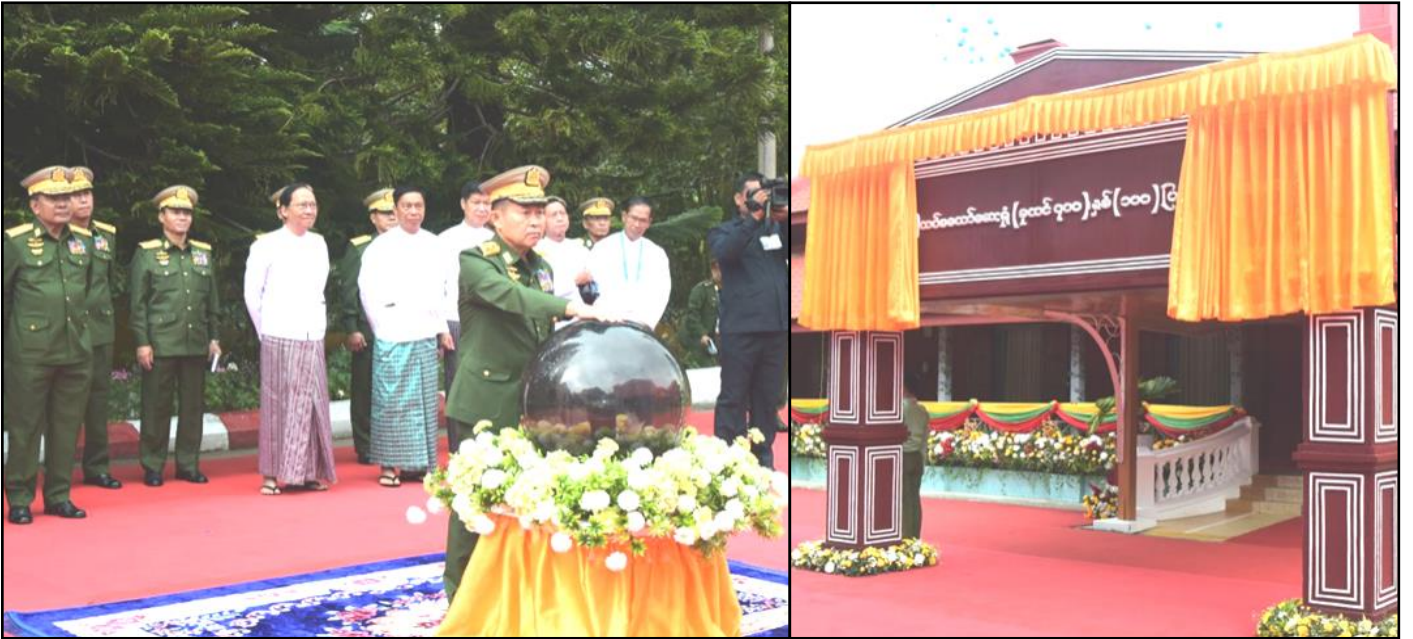
နိုင်ငံတော်စီမံအုပ်ချုပ်ရေးကောင်စီဒုတိယဥက္ကဋ္ဌ ဒုတိယတပ်မတော်ကာကွယ်ရေးဦးစီးချုပ် အမှတ် (၁) တပ်မတော်ဆေးရုံ(ခုတင်-၇၀၀) နှစ်(၁၀၀) ပြည့်အထိမ်းအမှတ်ဆိုင်းဘုတ်အား စက်ခလုတ်နှိပ်ဖွင့်လှစ်ပေးနေမှု

နိုင်ငံတော်စီမံအုပ်ချုပ်ရေးကောင်စီဒုတိယဥက္ကဋ္ဌ ဒုတိယတပ်မတော်ကာကွယ်ရေးဦးစီးချုပ် အမှတ်(၁)တပ်မတော်ဆေးရုံ(ခုတင်-၇၀၀)၊ နှစ်(၁၀၀)ပြည့် အခမ်းအနား၊ ဓာတ်ရောင်ခြည် နှင့်ကင်ဆာရောဂါကုသဆောင်ဖွင့်ပွဲနှင့် အကြိမ်(၃၀)မြောက် မြန်မာ့တပ်မတော် ဆေးပညာရပ်ဆိုင်ရာ နှီးနှောဖလှယ်ပွဲသို့ တက်ရောက်ချီးမြှင့်