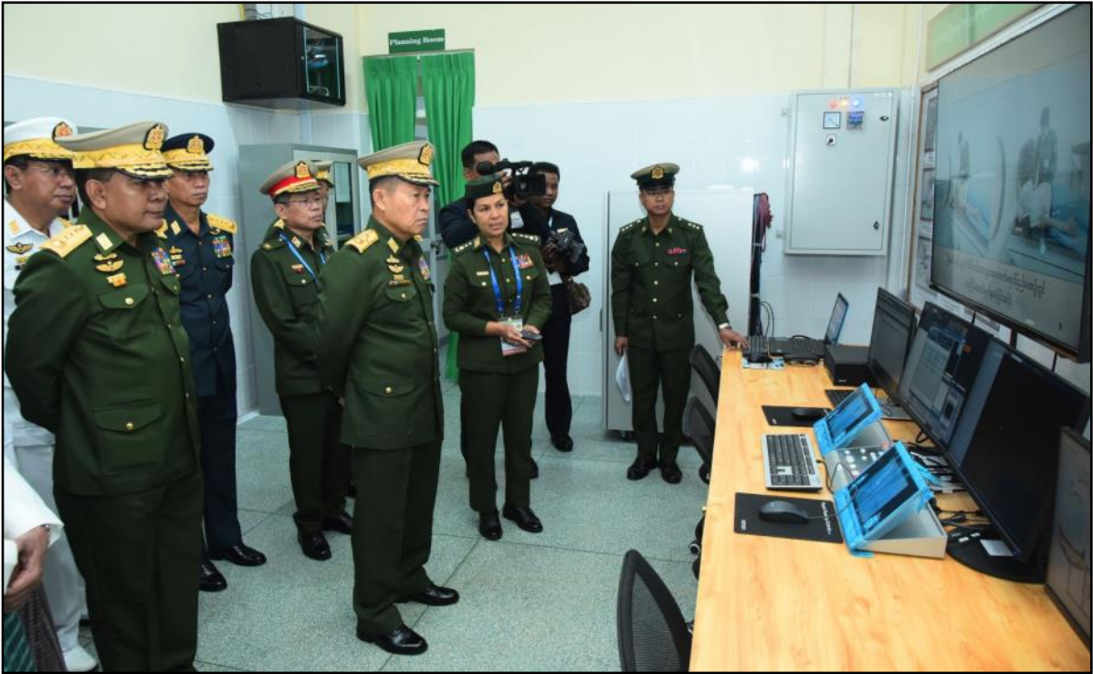
နိုင်ငံတော်စီမံအုပ်ချုပ်ရေးကောင်စီဒုတိယဥက္ကဋ္ဌ ဒုတိယတပ်မတော်ကာကွယ်ရေးဦးစီးချုပ် ဓာတ်ရောင်ခြည်နှင့်ကင်ဆာရောဂါ ကုသဆောင်အတွင်း လှည့်လည်ကြည့်ရှုနေမှု

ပြည်သူလူထု စုစုပေါင်း ၂၈၃၄၉ ဦးအတွက် ဆေးကုသမှု နှင့် ရောဂါကာကွယ်ထိန်းချုပ်ရေးဆိုင်ရာလုပ်ငန်းများကို အားကြီးမာန်တက်ဆောင်ရွက်ပေးခဲ့ကြကြောင်း။