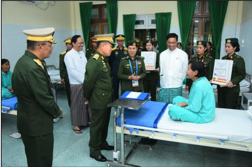
နိုင်ငံတော်စီမံအုပ်ချုပ်ရေးကောင်စီဒုတိယဥက္ကဋ္ဌ ဒုတိယတပ်မတော်ကာကွယ်ရေးဦးစီးချုပ် ကင်ဆာဆောင်၌ တက်ရောက်ဆေးကုသမှုခံယူလျက်ရှိသည့်လူနာများအား ကြည့်ရှုအားပေးကာ စားသောက်ဖွယ်ရာများထောက်ပံ့ပေးအပ်နေမှု

ကျင်သူ စုစုပေါင်း ၄၁၅၈ ဦး၊ ဘွဲ့လွန်ဒီပလိုမာရရှိသူ ၅၂၆ ဦး၊ မဟာဘွဲ့ရရှိသူ ၆၄၁ ဦးနှင့် ပါရဂူဘွဲ့ရရှိသူ ၃၀ ဦး ရှိခဲ့သည်ကို တွေ့ရှိရကြောင်း။