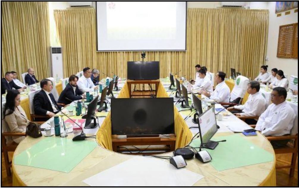
ပြည်ထောင်စုဝန်ကြီး ဦးလှမိုး ရုရှားဖက်ဒရေးရှင်းနိုင်ငံ ရော့စ်ကွန်ဂရက်ရင်းနှီးမြှုပ်နှံမှုရန်ပုံငွေအဖွဲ့၊ ညွှန်ကြားရေးမှူးဦးဆောင်သော ကိုယ်စားလှယ်အဖွဲ့အား လက်ခံတွေ့ဆုံနေမှု

သမဝါယမနှင့်ကျေးလက်ဖွံ့ဖြိုးရေးဝန်ကြီးဌာန ပြည်ထောင်စုဝန်ကြီး ဦးလှမိုး၊ သယံဇာတနှင့် သဘာဝပတ်ဝန်းကျင် ထိန်းသိမ်းရေးဝန်ကြီးဌာန ပြည်ထောင်စုဝန်ကြီး ဦးခင်မောင်ရီ၊ လျှပ်စစ်စွမ်းအားဝန်ကြီးဌာန ပြည်ထောင်စုဝန်ကြီး ဦးညာဏ်ထွန်းနှင့် စွမ်းအင်ဝန်ကြီးဌာန ပြည်ထောင်စုဝန်ကြီး ဦးကိုကိုလွင်တို့သည် ရုရှားဖက်ဒရေးရှင်းနိုင်ငံ ရော့စ်ကွန်ဂရက်ရင်းနှီးမြှုပ်နှံမှုရန်ပုံငွေအဖွဲ့ (Ros-Congress Investments Fund) မှ Mr. SHATIROV Alexander Sergeevich ဦးဆောင်သော ကိုယ်စားလှယ်အဖွဲ့ကို နိုဝင်ဘာလ ၈ ရက်တွင် သက်ဆိုင်ရာဝန်ကြီးဌာနအသီးသီး၌ လက်ခံတွေ့ဆုံခဲ့ပါသည်။