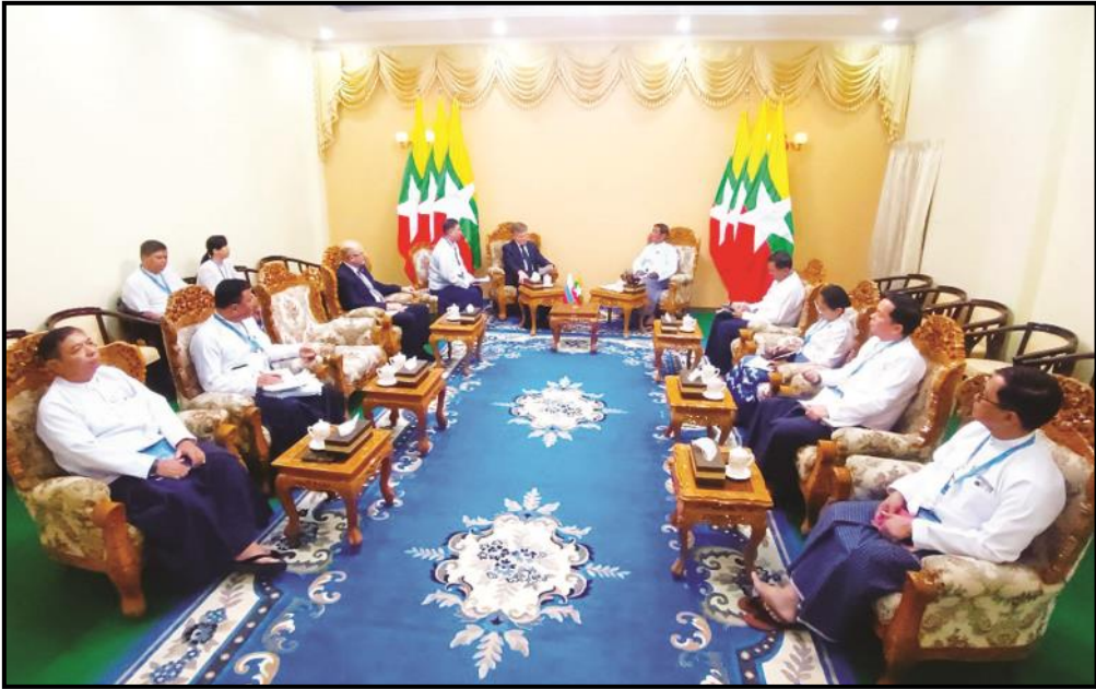
ပြည်ထောင်စုဝန်ကြီး ဦးညွှတ်ထွန်း မြန်မာနိုင်ငံဆိုင်ရာ ရုရှားနိုင်ငံသံအမတ်ကြီးအား လက်ခံတွေ့ဆုံနေမှု