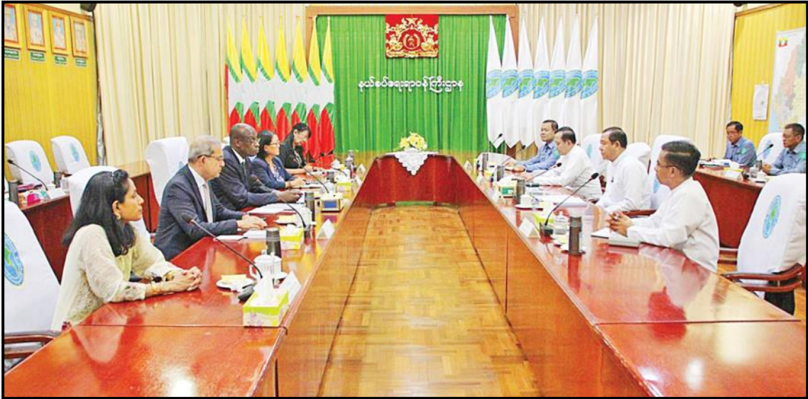
ပြည်ထောင်စုဝန်ကြီး ဒုတိယဗိုလ်ချုပ်ကြီး ထွန်းထွန်းနောင် ကုလသမဂ္ဂဒုက္ခသည်များဆိုင်ရာ မဟာမင်းကြီးရုံး (UNHCR) ၏ လုပ်ငန်းလည်ပတ်မှုဆိုင်ရာ လက်ထောက်မဟာမင်းကြီး Mr. Raouf Mazou အား လက်ခံတွေ့ဆုံနေမှု