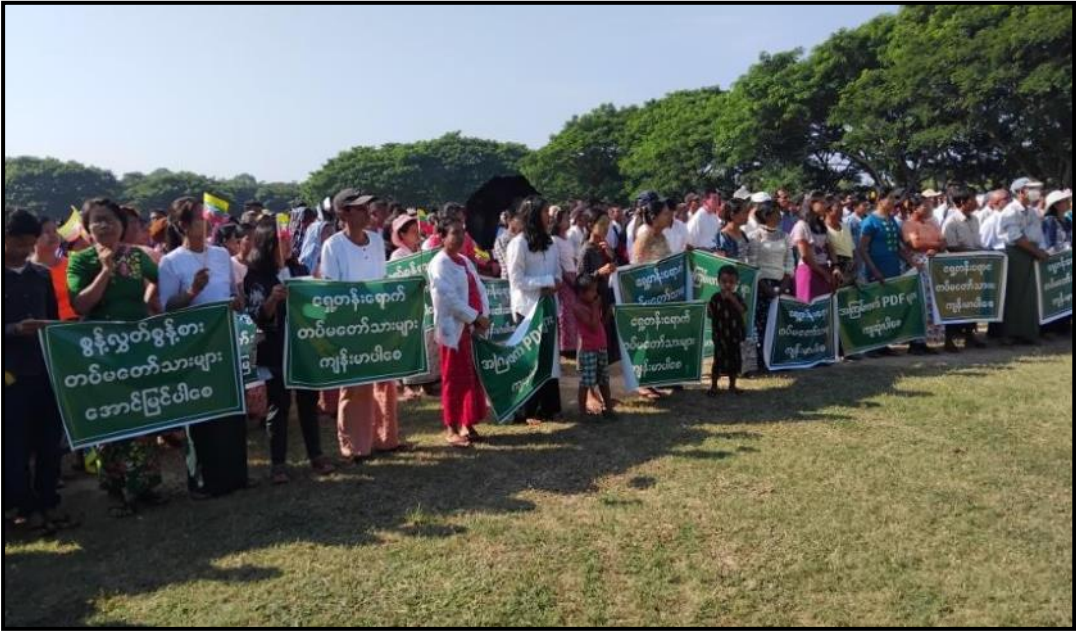
ပြည်ထောင်စုနယ်မြေ နေပြည်တော် မြေညီရိမြို့နယ်၌ ပြည်သူများက အကြမ်းဖက်လက်နက်ကိုင်သောင်းကျန်းသူများအား ဆန့်ကျင်ရှုတ်ချပြီး နိုင်ငံတော်ကာကွယ်ရေးနှင့် လုံခြုံရေးတာဝန်ထမ်းဆောင်နေကြသည့် ရှေ့တန်းရောက်တပ်မတော်သားများအား ထောက်ခံပွဲကျင်းပနေမှု