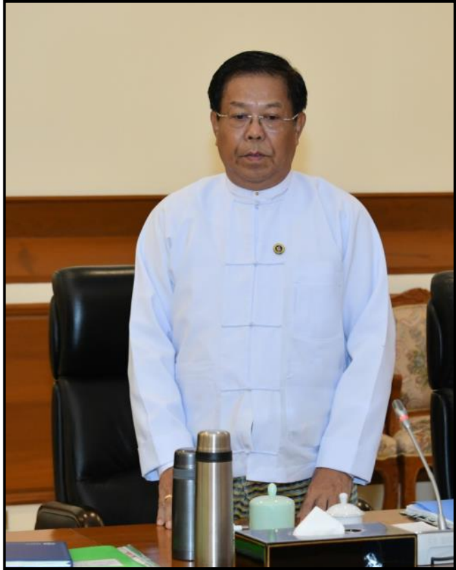
နိုင်ငံခြားရေးဝန်ကြီးဌာန ပြည်ထောင်စုဝန်ကြီး ဦးသန်းဆွေ ရှင်းလင်းတင်ပြနေမှု