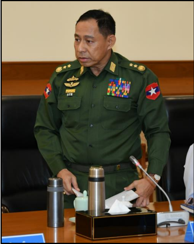
ပြည်ထဲရေးဝန်ကြီးဌာန ပြည်ထောင်စုဝန်ကြီး ဒုတိယဗိုလ်ချုပ်ကြီး ရာပြည့် ရှင်းလင်းတင်ပြနေမှု