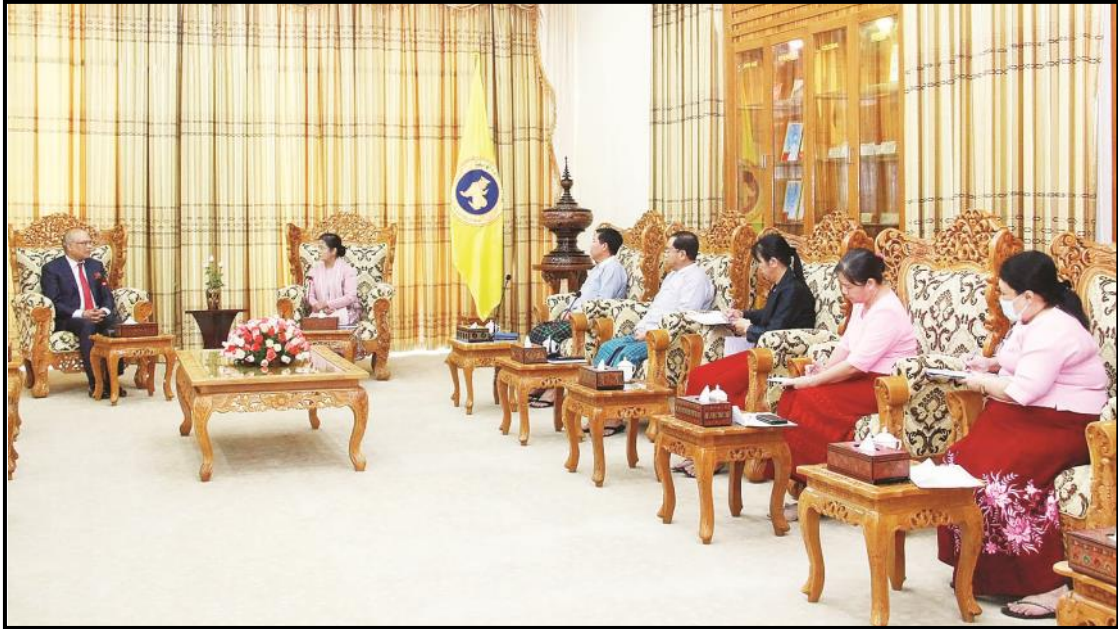
မြန်မာနိုင်ငံဆိုင်ရာ ဘင်္ဂလားဒေ့ရှ်နိုင်ငံ သံအမတ်ကြီးအား မြန်မာနိုင်ငံတော်ဗဟိုဘဏ်ဥက္ကဋ္ဌ ဒေါ်သန်းသန်းဆွေ လက်ခံတွေ့ဆုံနေမှု