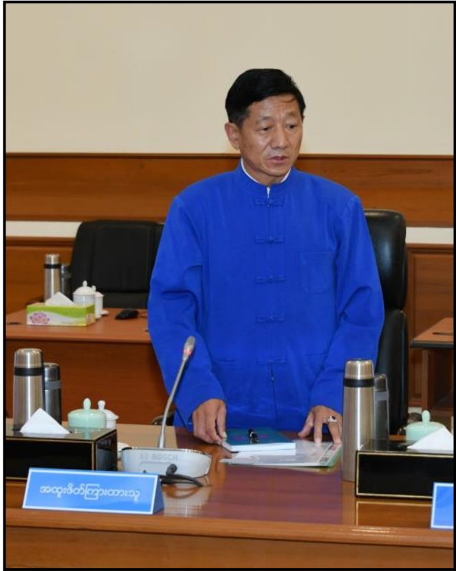
ကိုးကန့်ကိုယ်ပိုင်အုပ်ချုပ်ခွင့်ရဒေသ ဥက္ကဋ္ဌ ဦးမြင့်ဆွေ ရှင်းလင်းတင်ပြနေမှု