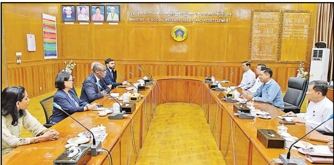
ပြည်ထောင်စုဝန်ကြီး ဒေါက်တာစိုးဝင်း ကုလသမဂ္ဂဒုက္ခသည်များဆိုင်ရာ မဟာမင်းကြီးရုံး (UNHCR) ၏ လုပ်ငန်းလည်ပတ်မှုဆိုင်ရာ လက်ထောက်မဟာမင်းကြီး Mr. Raouf Mazou အား လက်ခံတွေ့ဆုံနေမှု