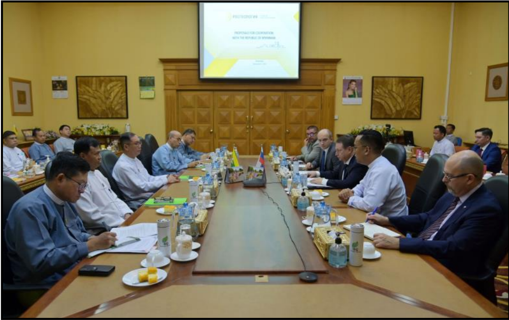
ပြည်ထောင်စုဝန်ကြီး ဦးခင်မောင်ရီ ရုရှားဖက်ဒရေးရှင်းနိုင်ငံ ရော့စ်ကွန်ဂရက်ရင်းနှီးမြှုပ်နှံမှုရန်ပုံငွေအဖွဲ့ ညွှန်ကြားရေးမှူးဦးဆောင်သော ကိုယ်စားလှယ်အဖွဲ့အား လက်ခံတွေ့ဆုံနေမှု

ပူးပေါင်းဆောင်ရွက်နိုင်မည့် ကိစ္စရပ်များကို ရင်းနှီးပွင့်လင်း စွာဆွေးနွေးခဲ့။