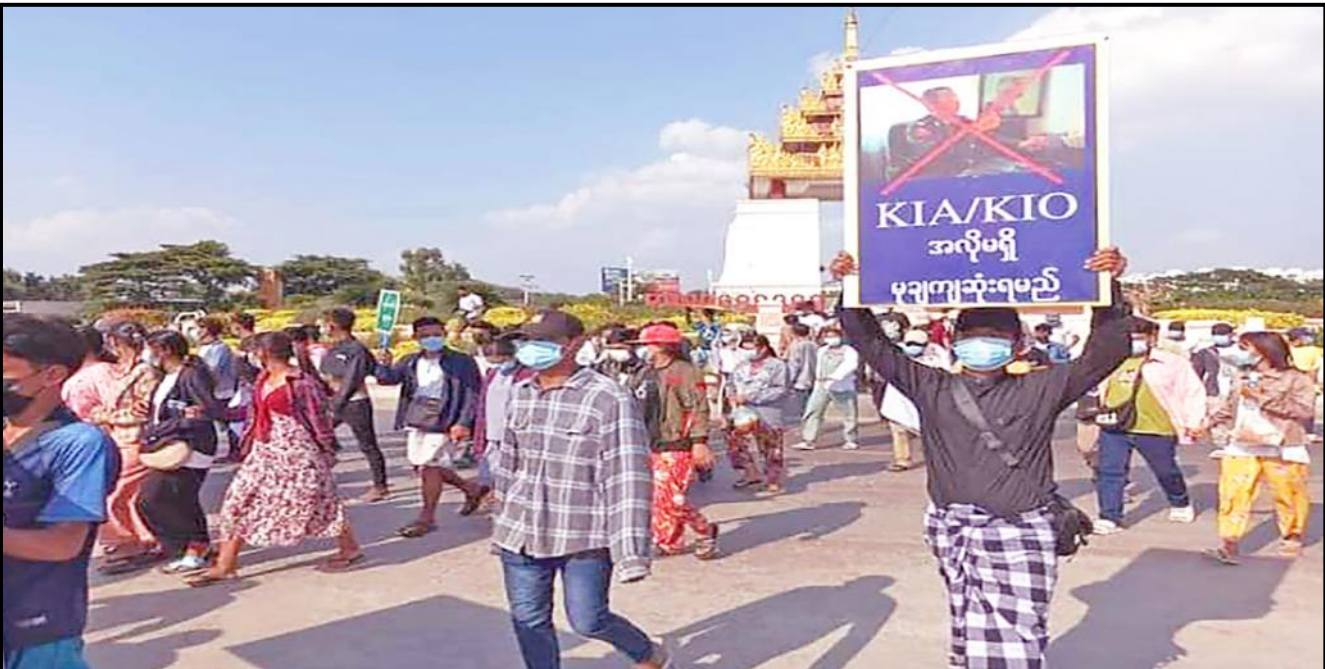
မန္တလေးမြို့၌ ပြည်သူများက အကြမ်းဖက်လက်နက်ကိုင်သောင်းကျန်းသူများအား ဆန့်ကျင်ရှုတ်ချပြီး နိုင်ငံတော်ကာကွယ်ရေးနှင့် လုံခြုံရေးတာဝန်ထမ်းဆောင်နေကြသည့် ရှေ့တန်းရောက် တပ်မတော်သားများအား ထောက်ခံပွဲကျင်းပနေမှု

ရှမ်းပြည်နယ်(မြောက်ပိုင်း)ရှိ မြို့နယ်အချို့တွင် အောက်တိုဘာလ ၂၇ ရက်မှစ၍ အကြမ်းဖက်လက်နက်ကိုင်သောင်းကျန်းသူများက အင်အားအလုံးအရင်းဖြင့် ဝင်ရောက်တိုက်ခိုက်ခဲ့သဖြင့် ရှေ့တန်းစစ်မျက်နှာအသီးသီးတွင် နိုင်ငံတော်ကာကွယ်ရေးနှင့် လုံခြုံရေးတာဝန်ထမ်းဆောင်နေကြသည့် တပ်မတော်သားများ၊ မြန်မာနိုင်ငံ ရဲတပ်ဖွဲ့ဝင်များ၊ ပြည်သူ့စစ်များနှင့် ၎င်းတို့၏မိသားစုဝင်များကို ငြိမ်းချမ်းရေးလိုလားသည့် ပြည်သူများက အားပေးထောက်ခံလျက်ရှိပါသည်။