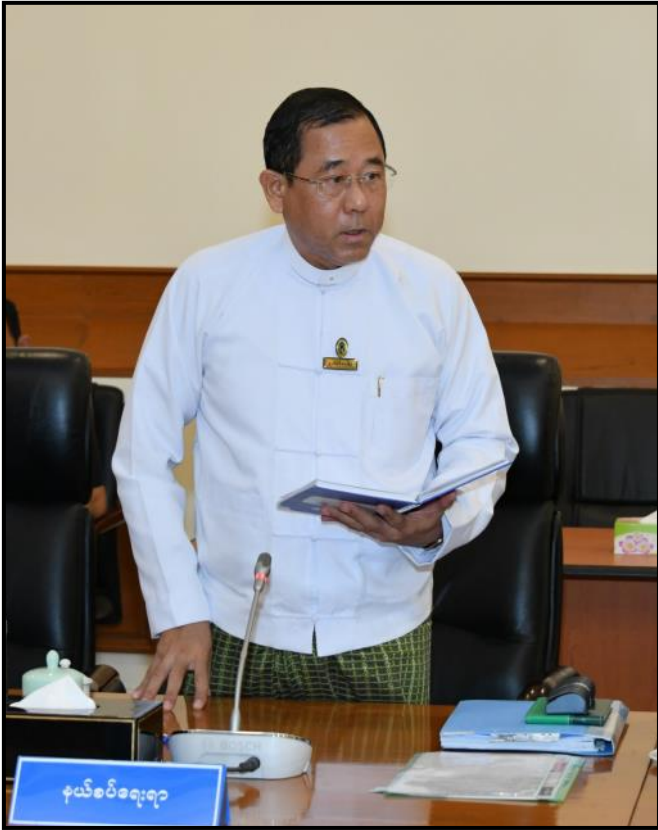
နယ်စပ်ရေးရာဝန်ကြီးဌာန ပြည်ထောင်စုဝန်ကြီး ဒုတိယဗိုလ်ချုပ်ကြီး ထွန်းထွန်းနောင် ရှင်းလင်းတင်ပြနေမှု