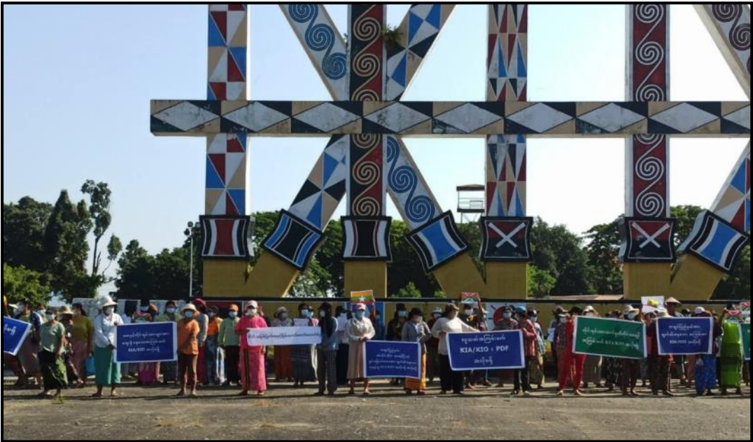
ကချင်ပြည်နယ် မြစ်ကြီးနားမြို့ မနောကွင်း၌ ပြည်သူများက အကြမ်းဖက်လက်နက်ကိုင်သောင်းကျန်းသူများအား ဆန့်ကျင်ရှုတ်ချပြီး နိုင်ငံတော်ကာကွယ်ရေးနှင့် လုံခြုံရေးတာဝန်ထမ်းဆောင်နေကြသည့် ရှေ့တန်းရောက်တပ်မတော်သားများအား ထောက်ခံပွဲကျင်းပနေမှု

ရှေ့တန်းရောက် တပ်မတော်သားများအား ထောက်ခံအားပေး ပွဲကို ဆိုင်းဘုတ်များ ကိုင်ဆောင်၍ ဆန္ဒထုတ်ဖော်ခဲ့ကြပါသည်။