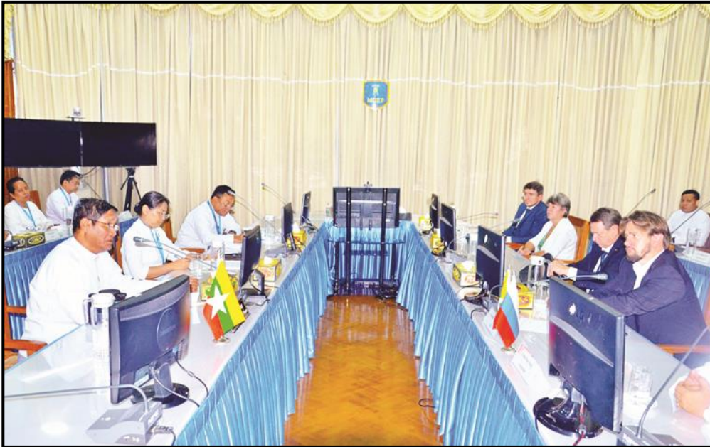
ပြည်ထောင်စုဝန်ကြီး ဦးညွှန်ထွန်း ရုရှားဖက်ဒရေးရှင်းနိုင်ငံ ရှော့စ်ကွန်ဂရက်ရင်းနှီးမြုပ်နှံမှုရန်ပုံငွေအဖွဲ့ ညွှန်ကြားရေးမှူးဦးဆောင်သော ကိုယ်စားလှယ်အဖွဲ့အား လက်ခံတွေ့ဆုံနေမှု