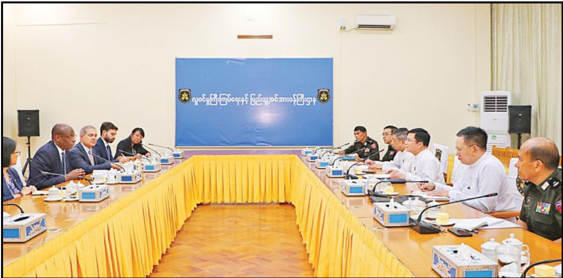
ပြည်ထောင်စုဝန်ကြီး ဦးမြင့်ကြိုင် ကုလသမဂ္ဂဒုက္ခသည်များဆိုင်ရာ မဟာမင်းကြီးရုံး (UNHCR) ၏ လုပ်ငန်းလည်ပတ်မှုဆိုင်ရာ လက်ထောက်မဟာမင်းကြီး Mr. Raouf Mazou အား လက်ခံတွေ့ဆုံနေမှု