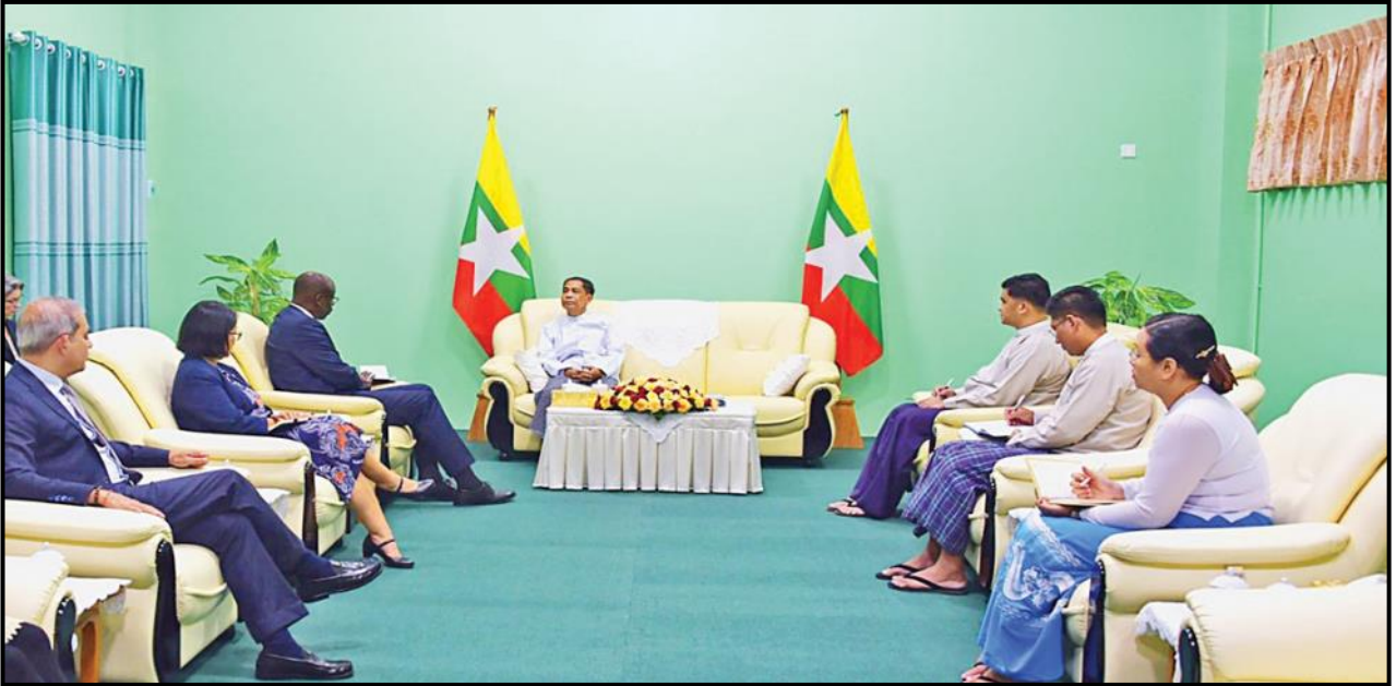
ပြည်ထောင်စုဝန်ကြီး ဦးကိုကိုလှိုင် ကုလသမဂ္ဂဒုက္ခသည်များဆိုင်ရာ မဟာမင်းကြီးရုံး (UNHCR) ၏ လုပ်ငန်းလည်ပတ်မှုဆိုင်ရာ လက်ထောက်မဟာမင်းကြီး Mr. Raouf Mazou အား လက်ခံတွေ့ဆုံနေမှု

နယ်မှ နေရပ်စွန့်ခွာသူများအား ပြန်လည်လက်ခံရေးလုပ်ငန်းစဉ်များနှင့်ပတ်သက်၍ ရင်းနှီးပွင့်လင်းစွာဆွေးနွေးခဲ့။