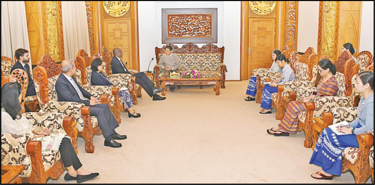
ဒုတိယဝန်ကြီးချုပ်နှင့် ပြည်ထောင်စုဝန်ကြီး ဦးသန်းဆွေ ကုလသမဂ္ဂဒုက္ခသည်များဆိုင်ရာ မဟာမင်းကြီးရုံး (UNHCR) ၏ လုပ်ငန်းလည်ပတ်မှုဆိုင်ရာ လက်ထောက်မဟာမင်းကြီး Mr. Raouf Mazou အား လက်ခံတွေ့ဆုံနေမှု

ပြည်ထောင်စုဝန်ကြီးများသည် ကုလသမဂ္ဂဒုက္ခသည်များဆိုင်ရာ မဟာမင်းကြီးရုံး (UNHCR) ၏ လုပ်ငန်းလည်ပတ်မှုဆိုင်ရာ လက်ထောက်မဟာမင်းကြီး Mr. Raouf Mazou ဦးဆောင်သောအဖွဲ့အား နိုဝင်ဘာလ ၉ ရက်တွင် သက်ဆိုင်ရာ ဝန်ကြီးဌာနအသီးသီး၏ အစည်းအဝေးခန်းမ၌ လက်ခံတွေ့ဆုံခဲ့ပါသည်-