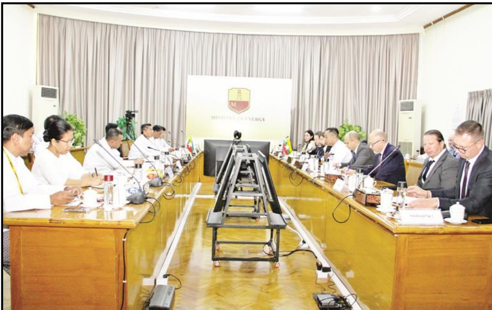
ပြည်ထောင်စုဝန်ကြီး ဦးကိုကိုလွင် ရုရှားဖက်ဒရေးရှင်းနိုင်ငံ ရှော့စ်ကွန်ဂရက်ရင်းနှီးမြုပ်နှံမှုရန်ပုံငွေအဖွဲ့ ညွှန်ကြားရေးမှူးဦးဆောင်သော ကိုယ်စားလှယ်အဖွဲ့အား လက်ခံတွေ့ဆုံနေမှု