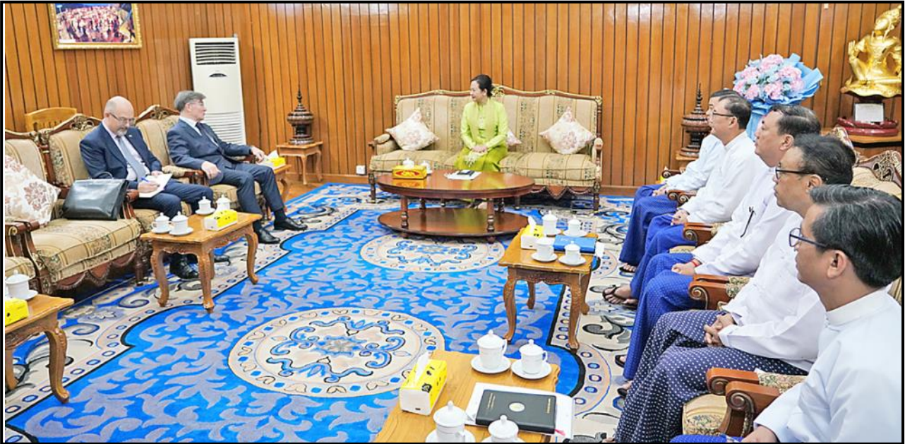
ပြည်ထောင်စုဝန်ကြီး ဒေါက်တာသက်သက်ခိုင် မြန်မာနိုင်ငံဆိုင်ရာ ရုရှားနိုင်ငံသံအမတ်ကြီးအား လက်ခံတွေ့ဆုံနေမှု